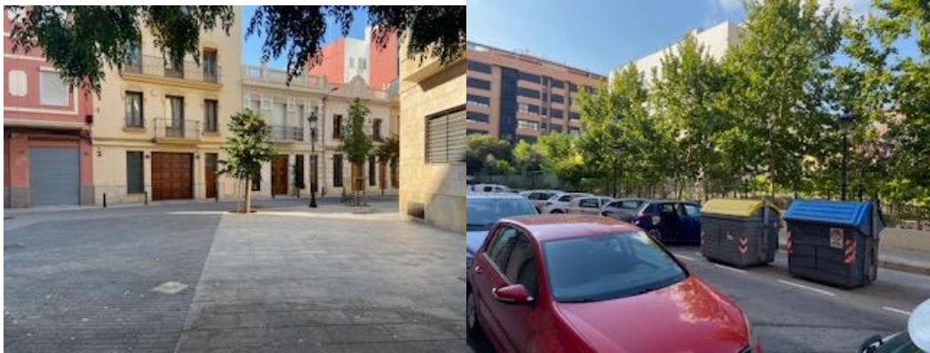
Fecha agosto 2023.

La plaza principal ha sido peatonalizada. En cuanto al mantenimiento del barrio, todavía existen solares sin construir con la consiguiente degradación de algunas zonas.