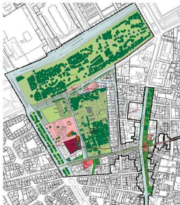
Il·lustració 2. Plano Integración Trini Simó