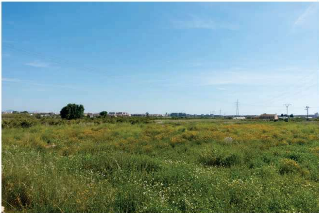
Ilustración 5. Ejemplo Núcleo de Polinizadores Naturalizada