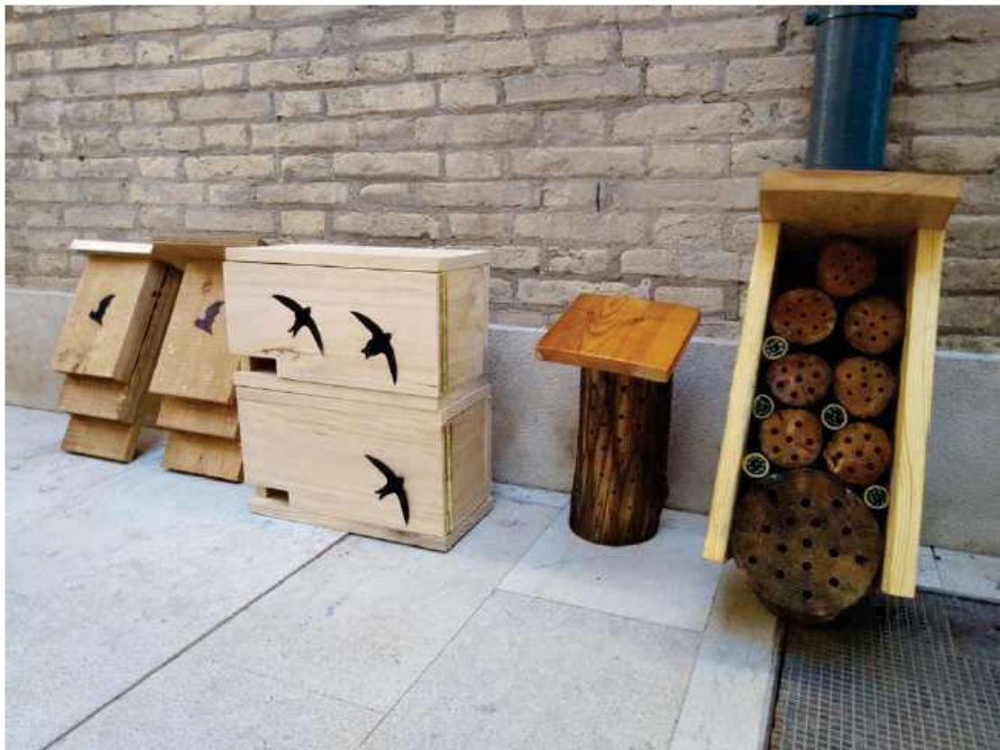
Il·lustració 9. Ejemplos Refugios fauna (Fabricación propia)