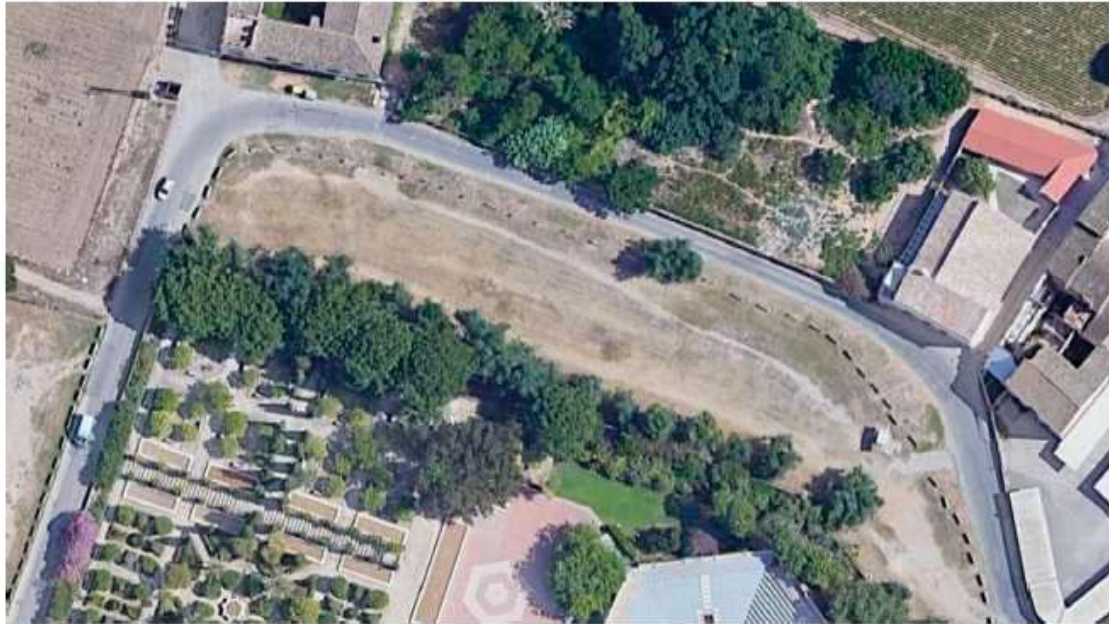
Il·lustració 8: Enclave Pilotos de Biodiversidad