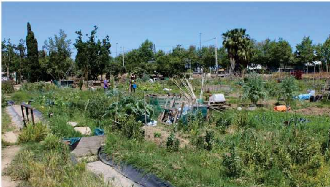
Ilustración 7 Ejemplo Huerto Urbano