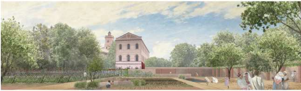
Il·lustració 3. Ejemplo de Jardín Mediterráneo