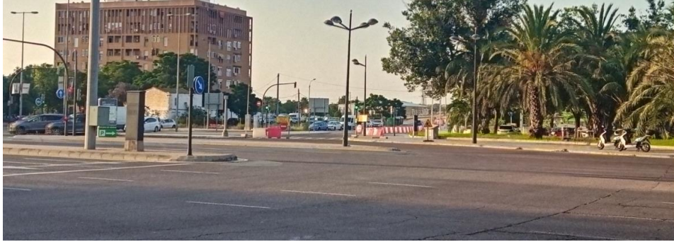
Imagen desde la Avenida Fernando Abril Martorell