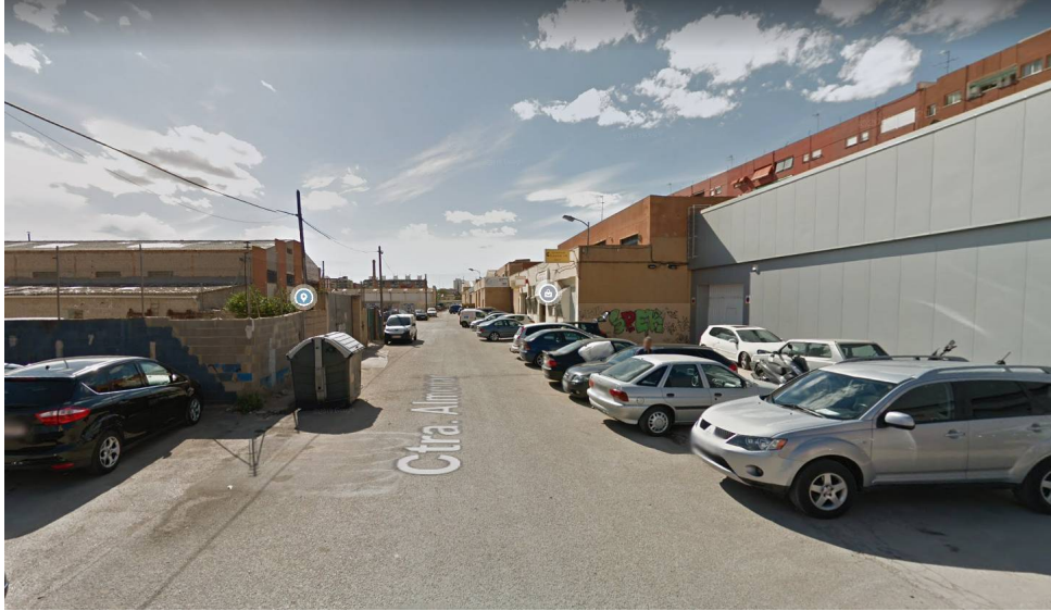
Fotografia 01 –