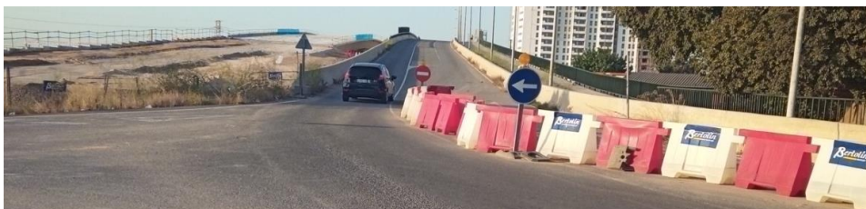
Señales verticales de dirección obligatoria y dirección prohibida