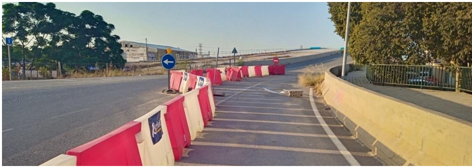
Señal de dirección obligatoria a un edificio y a lo lejos dirección prohibida