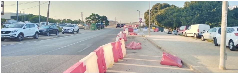
Restricción inicial al tráfico en la carretera Malilla