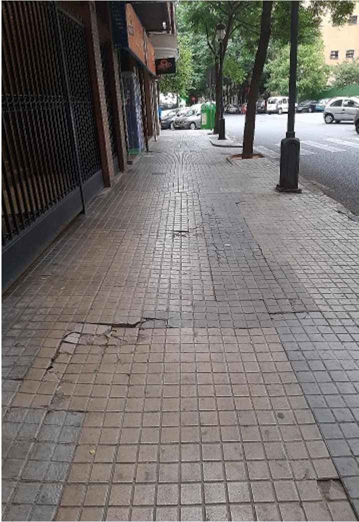
- Juan de Mena