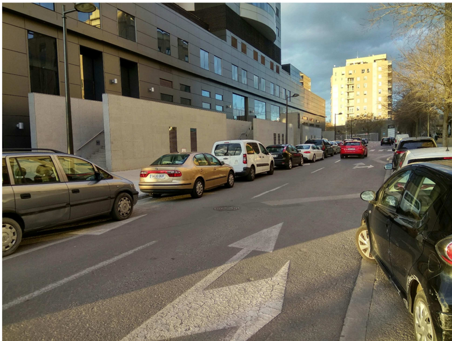
Imagen 2 – Situación actual con pérdida de un carril de circulación y doce árboles