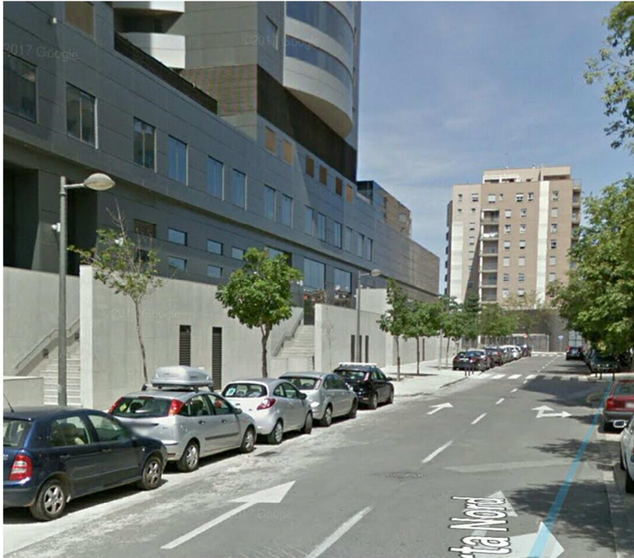
Imagen 3 – Calle l'Horta Nord previa a la actuación