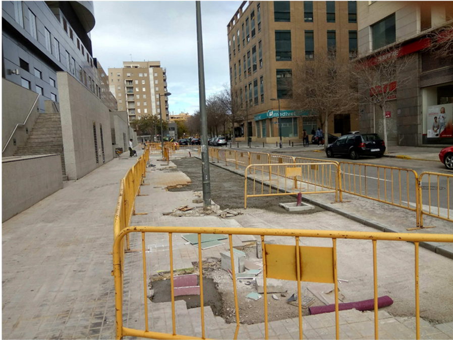
Imagen 1- Eliminación plazas parking Calle l'Horta Nord