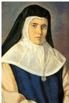
JOANA CONDESA LLUCH (1862 – 1916)

Fins els darrers dies de la seua vida, tot i la seua limitació física, no deixà participar en el Cor del CMD Natzaret, així com els diferents actes socials i manifestacions que pogué, transmetent sempre agraïment a la vida i ànims per no defallir en cada lluita específica. Catalina va morir el 20 d'abril de 2024, deixant-nos el llegat de continuar teixint un altre món, un altre barri possible.