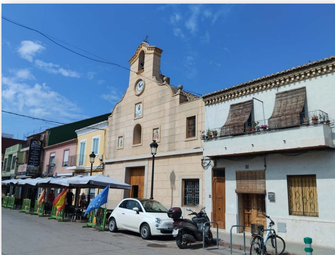
FOTOS 1 Y 2. La plaça de la Sequiota con la iglesia de Jesuset de l'Hort