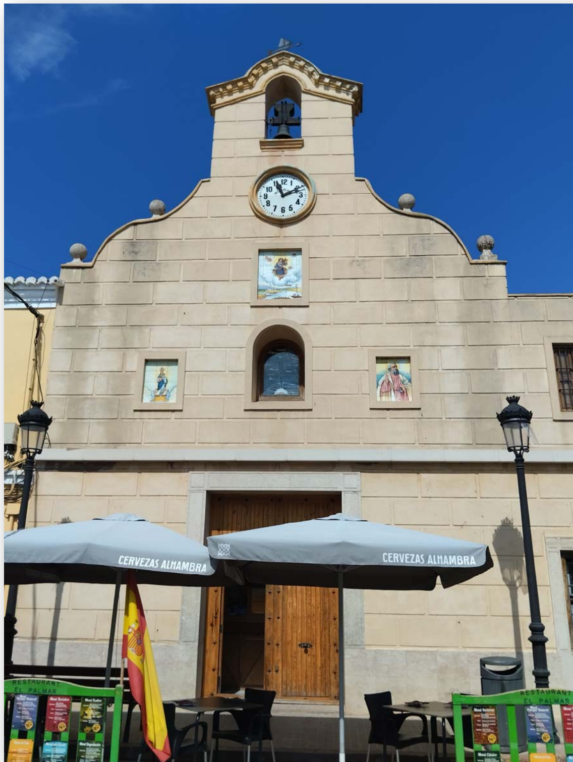
FOTO 3. La fachada de la iglesia de Jesuet de l'Hort