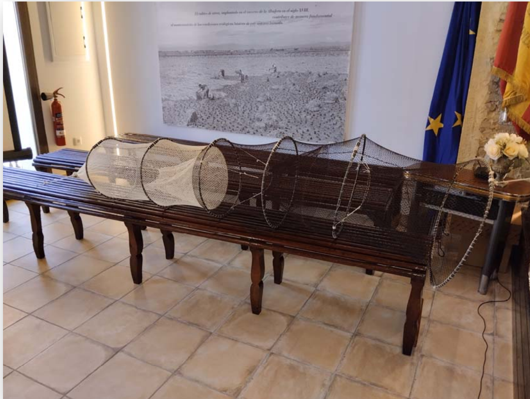
FOTO 6. Mornell , aparejo usado para la pesca de la anguila y otras especies