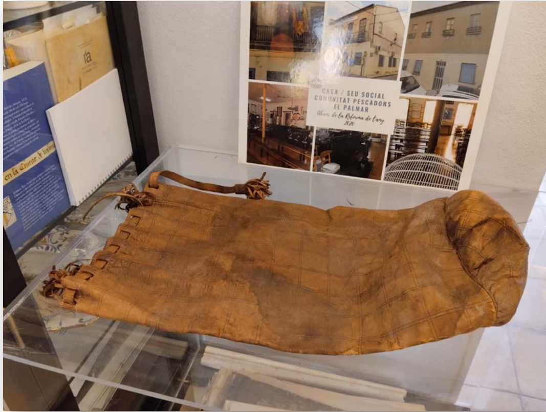
FOTO 5. Saco en el que antiguamente se realizaba el sorteo de redolins