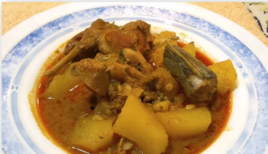
FOTO 9. Espardenyà