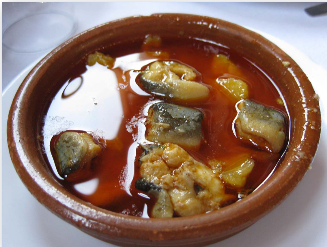
FOTO 8. All i pebre de anguila