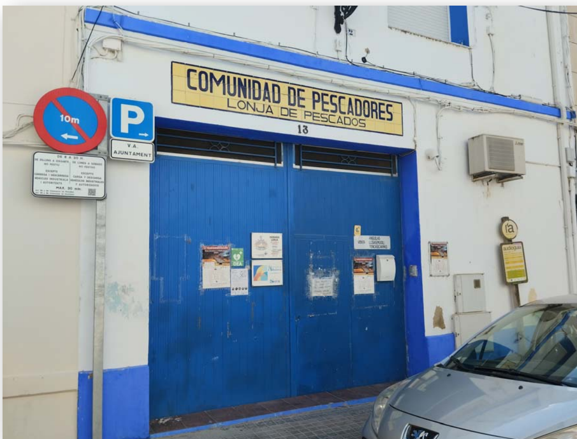
FOTOS 1 Y 2. Edificios de la Comunidad de Pescadores de El Palmar y de su Lonja