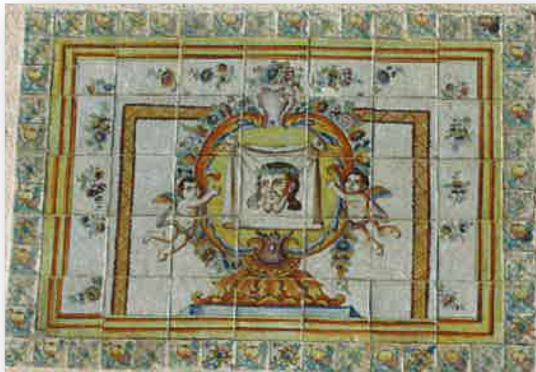
FOTOS 5 Y 6. Retablos del siglo XVIII en la fachada de la Casa Forestal, declarados Bien de Relevancia Local