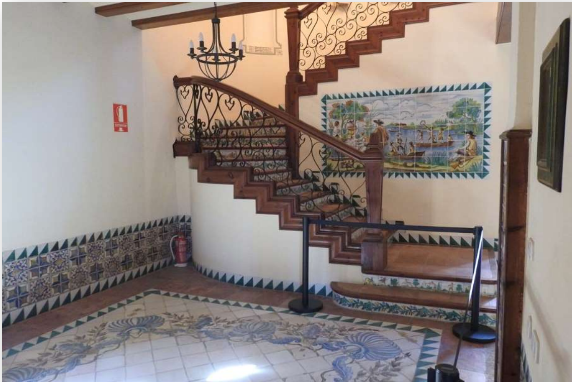
FOTOS 7 Y 8. Retablos de cerámica valenciana en el interior de la Casa Forestal