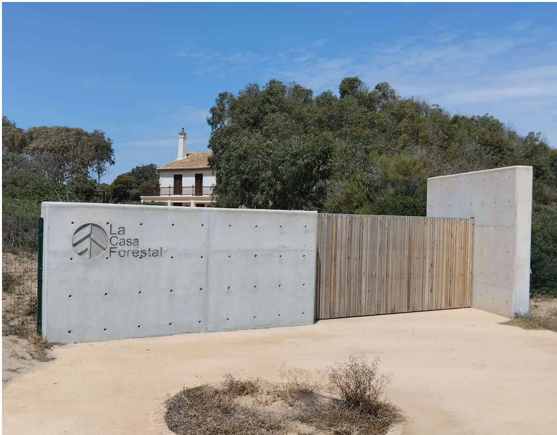
FOTO 10. Acceso a la Casa Forestal desde el paseo marítimo.