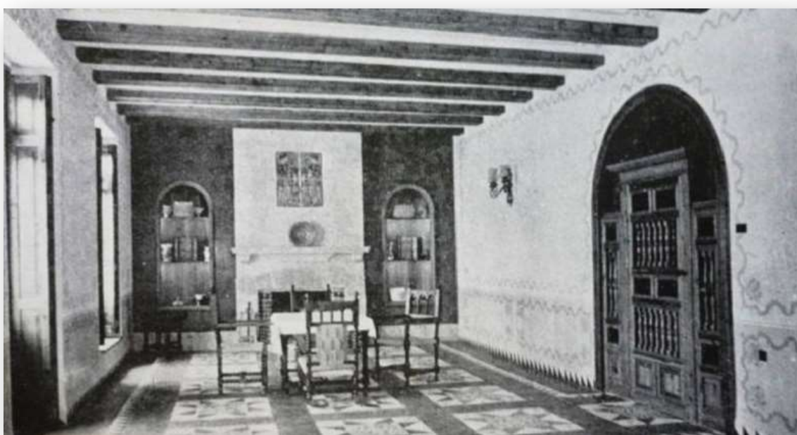
FOTOS 3 Y 4: Imágenes de la Casa Forestal en los años 20 del siglo XX.