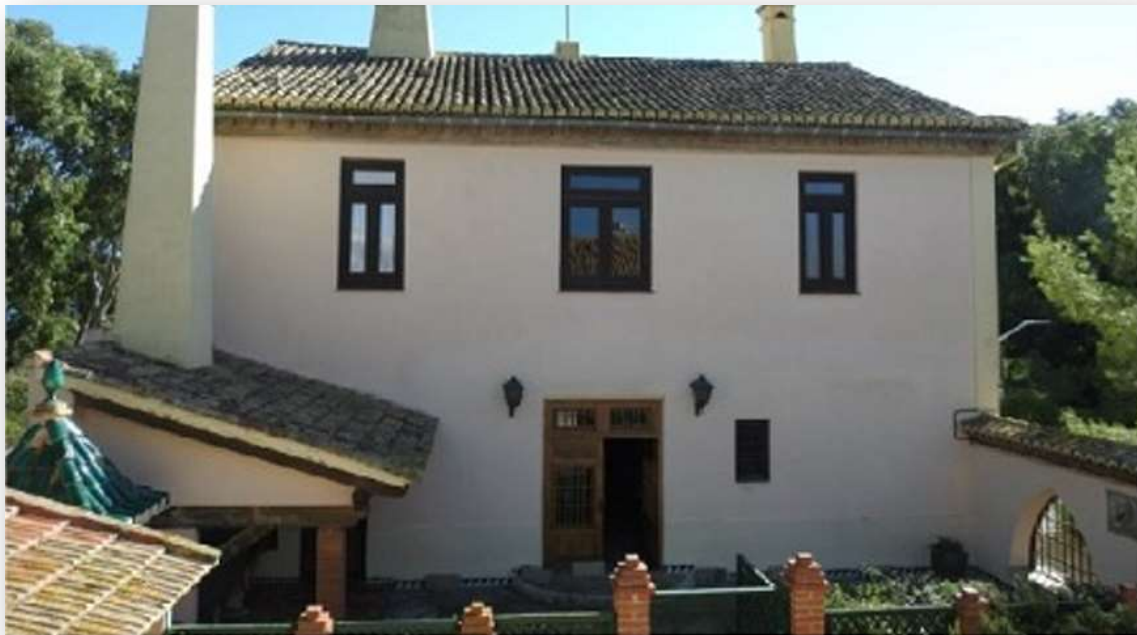
FOTOS 1 Y 2: La Casa Forestal en la actualidad