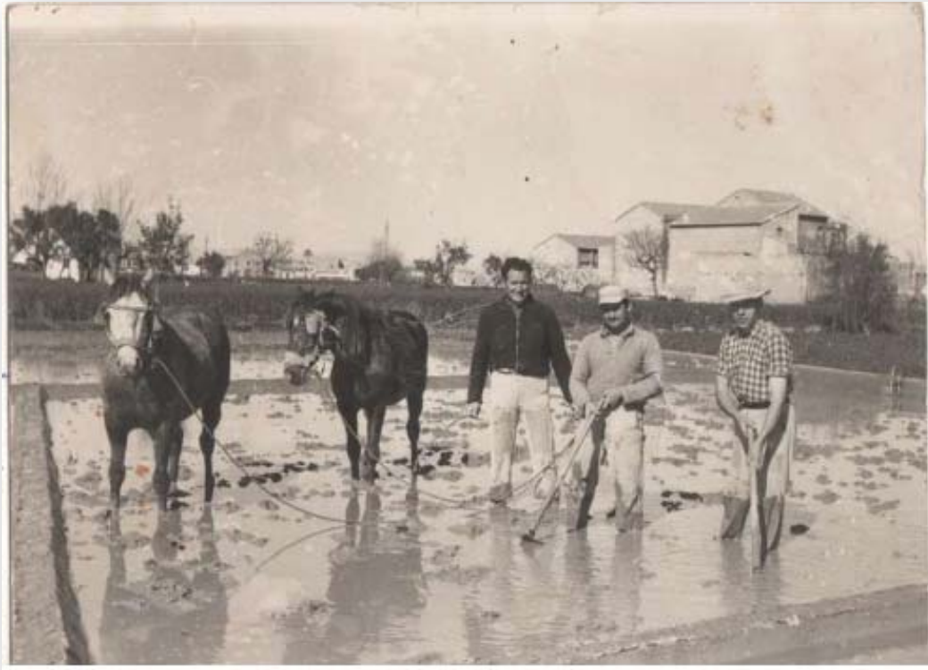
FOTO 1. Grupo de agricultores en un marjal de cultivo de arroz entorno a 1960.