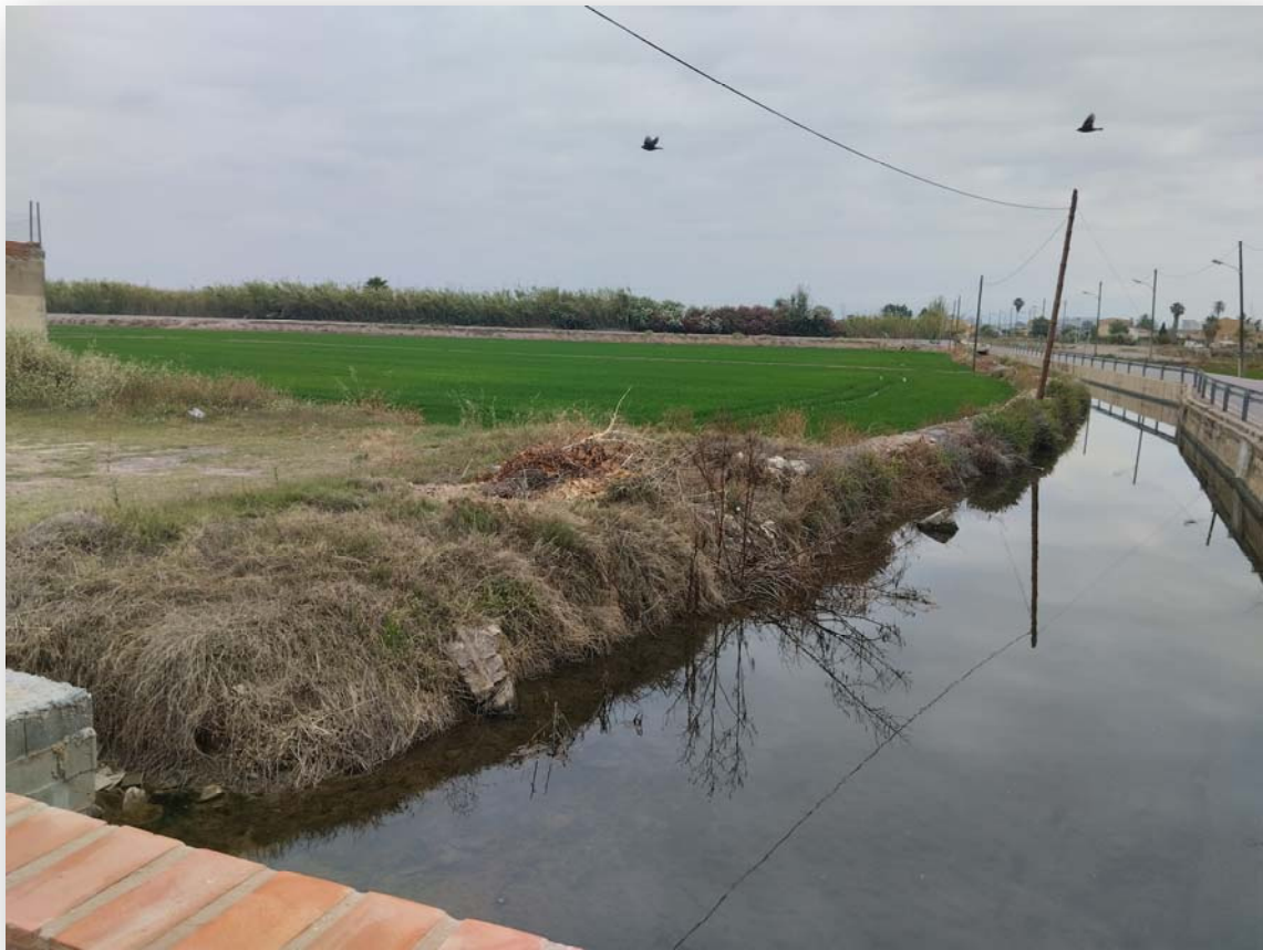
FOTOS 3 Y 4. Canales de riego en el barrio de El Tremolar