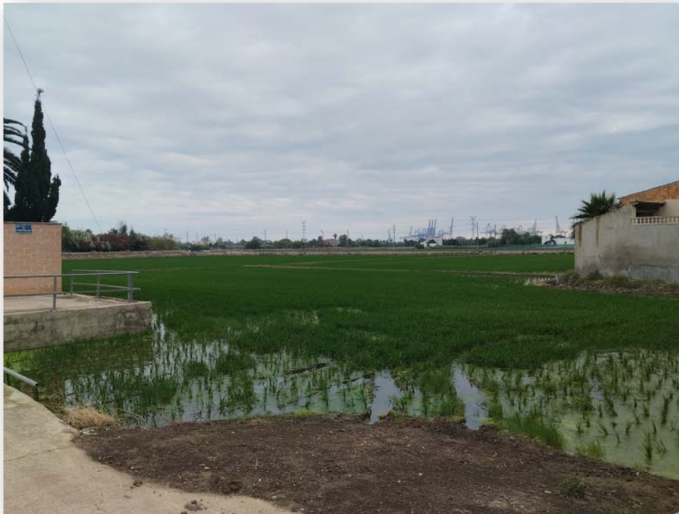
FOTO 2. Campo de arroz en la actualidad en el barrio de El Tremolar