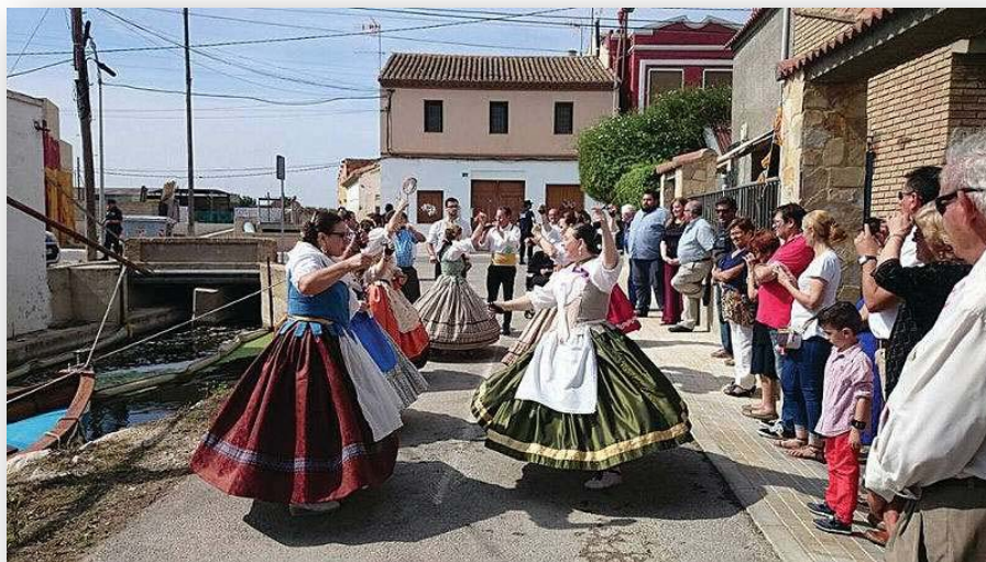
FOTOS 5, 6 Y 7. Las fiestas de El Tremolar