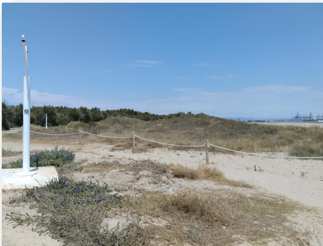
FOTOS 1 Y 2. Paisaje de la playa de l'Arbre del Gos.