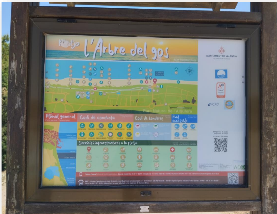
FOTO 5. Señalización de la playa de l'Arbre del Gos