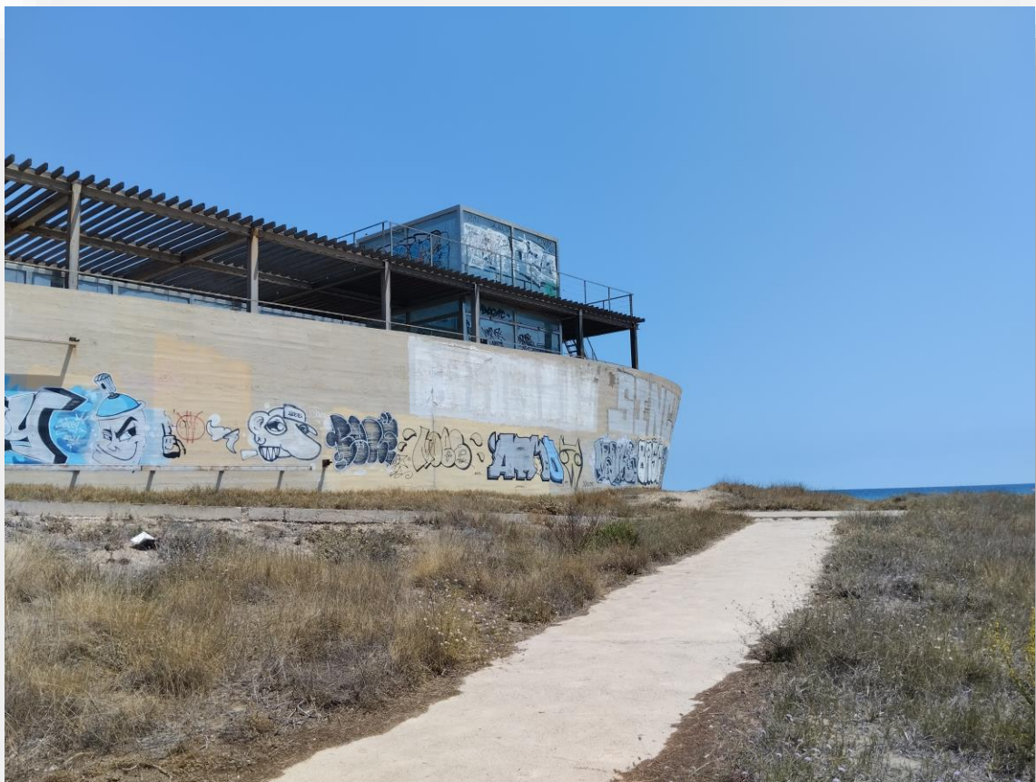
FOTOS 3 Y 4. El edificio de la escuela de estibadores