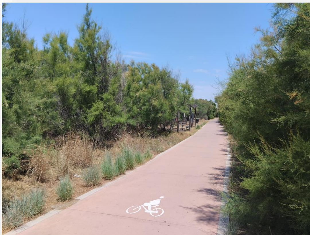
FOTO 6. Senda ciclable que comunica Pinedo con el Saler junto a la playa de l'Arbre del Gos