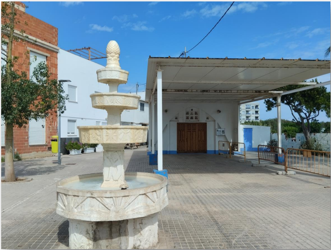
FOTOS 5 i 6. Església de la Verge del Carme