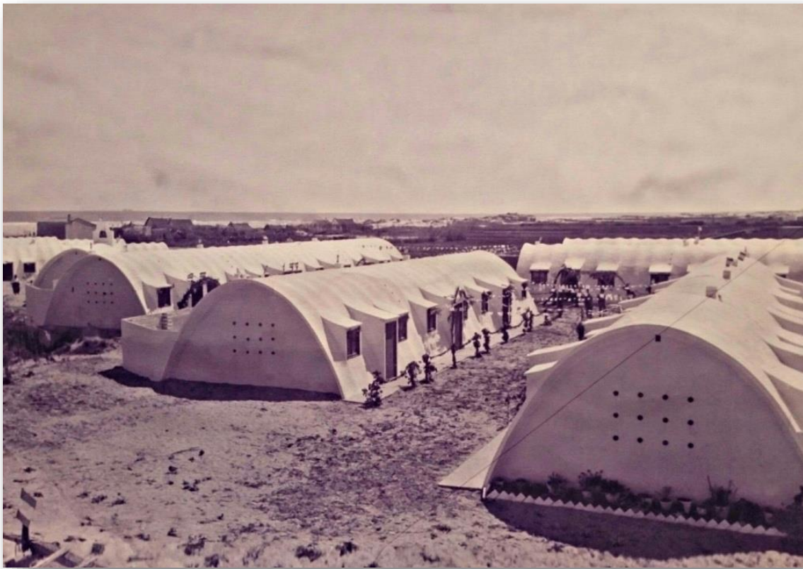
FOTO 3. Aspecte originari de les vivendes, en els anys 60 del segle XX