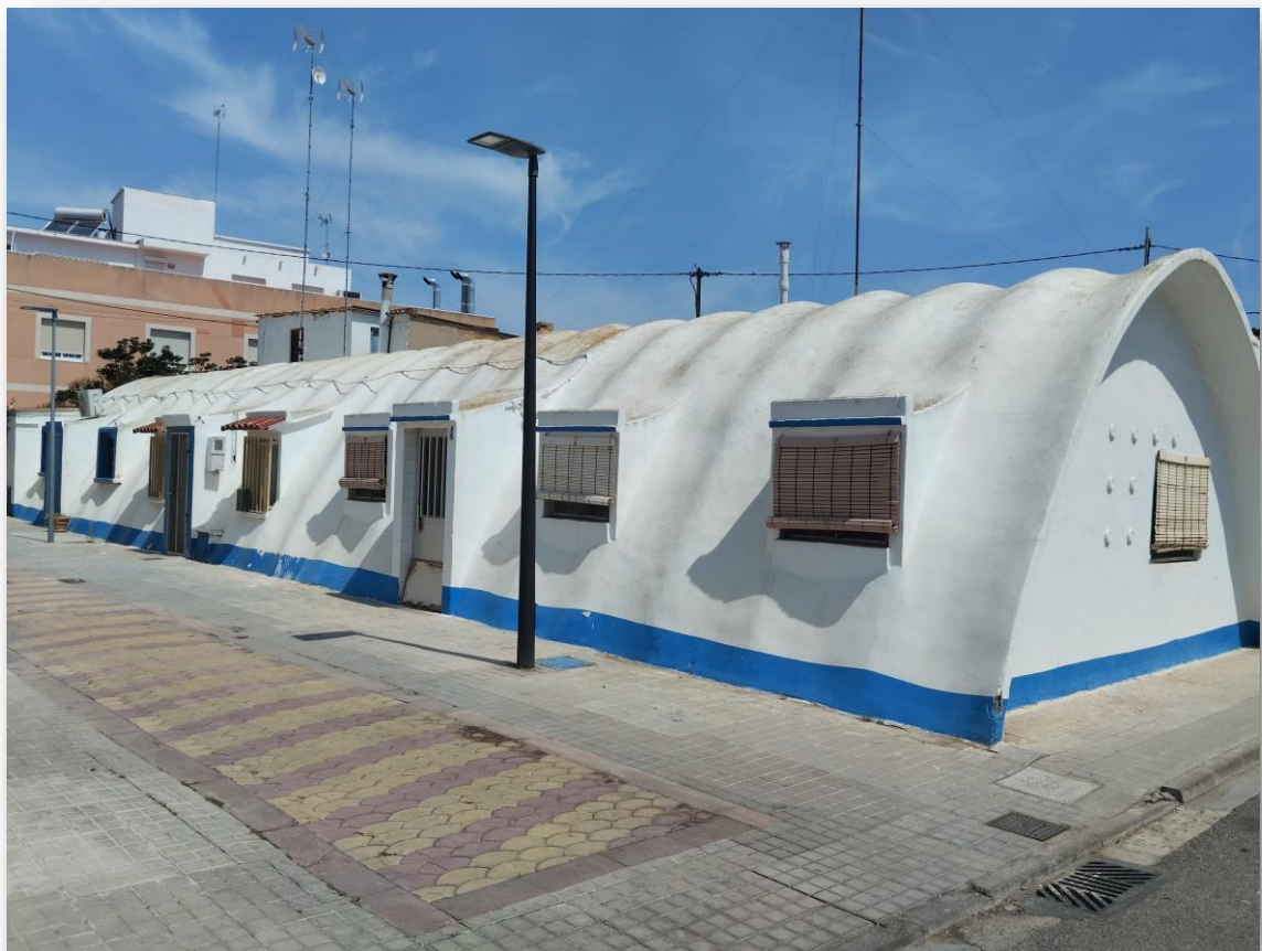
FOTOS 1 i 2. Grup de pescadors del Marqués de Vallterra en l'actualitat.