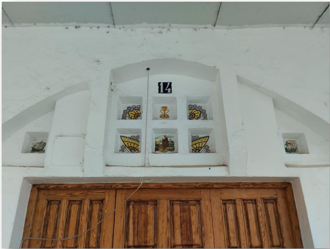
FOTO 7. Detall de l'arc d'entrada de l'església