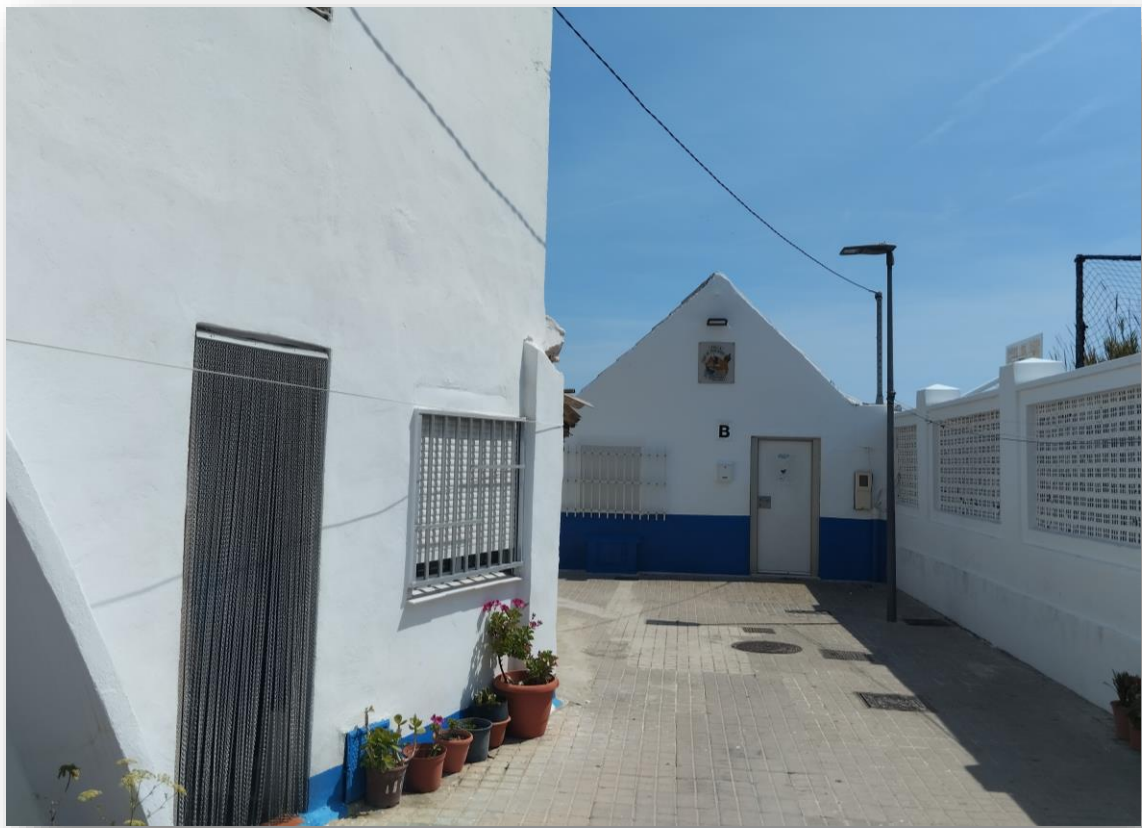
FOTO 9. Barraca, actual casal de la falla del Perellonet