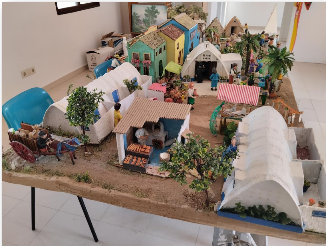
FOTO 10. Recreació de l'antic poble del Perellonet. Centre cívic (antigues escoles)