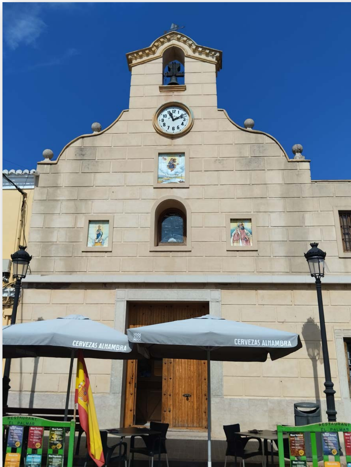
FOTO 3. La plaza de Patraix La frontera de l'església de Jesuset de l'Hort