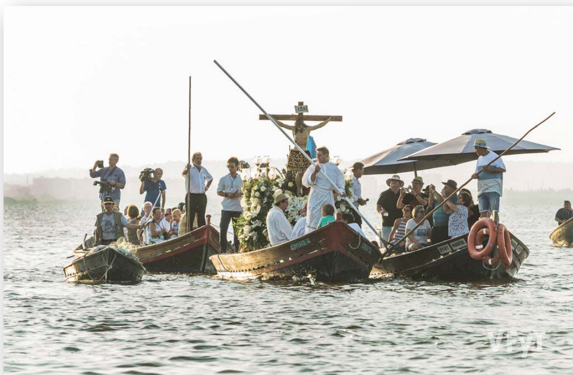
FOTOS 6 i 7. Festes del Crist de la Salut de 2018