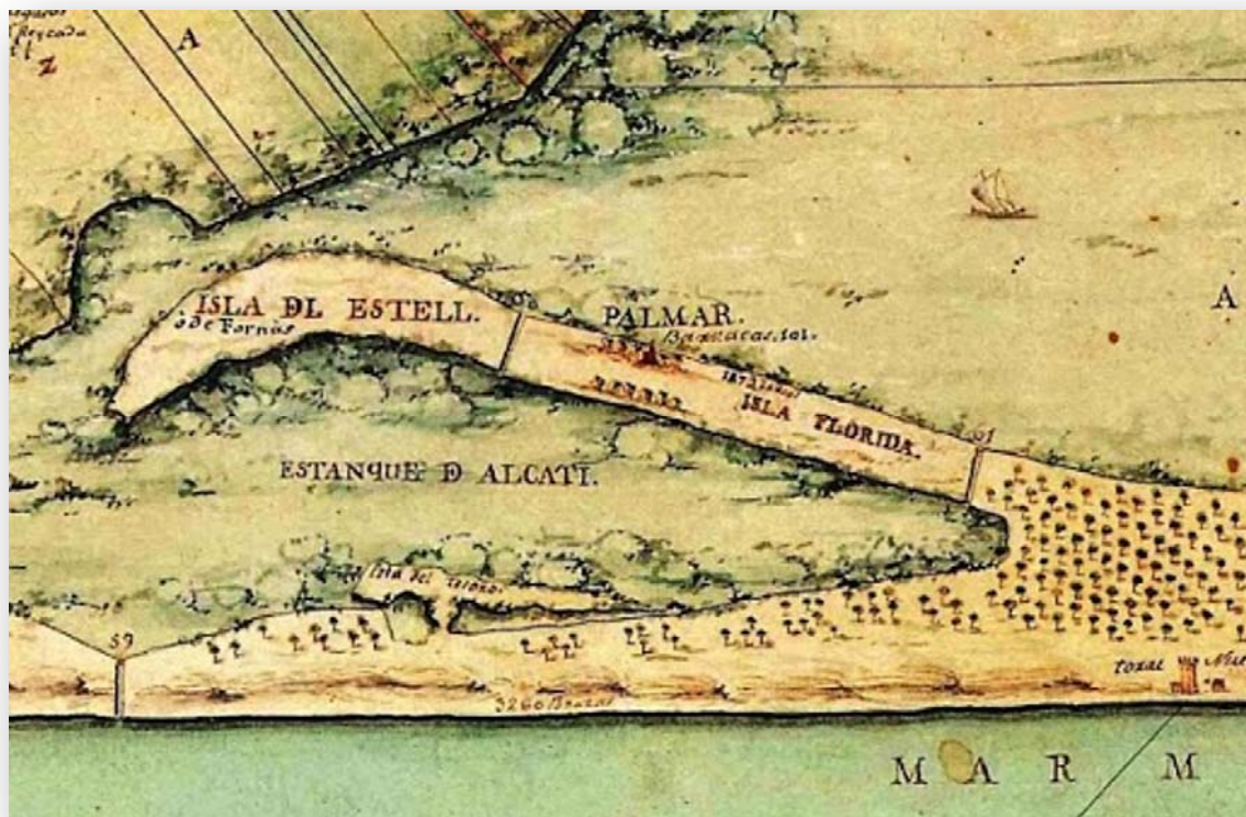
FOTO 8. El Palmar en el pla topogràfic de l'Albufera de València de Juan Bautista Romero