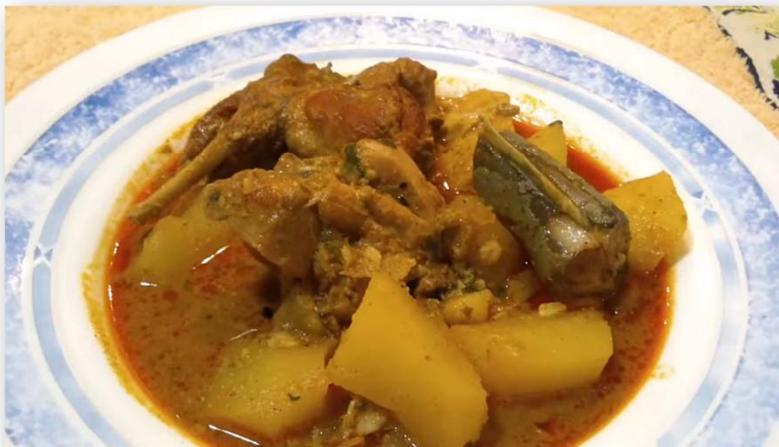
FOTO 9. Espardenyà