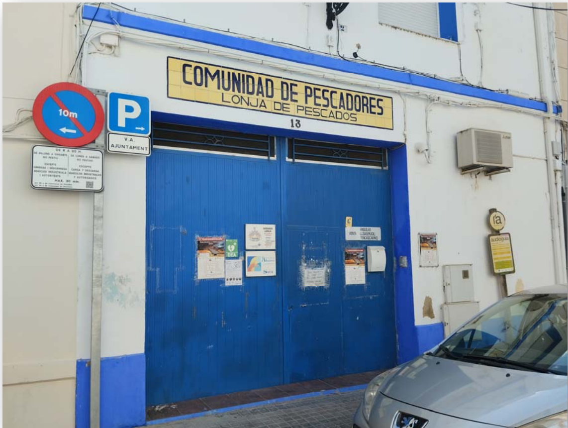
FOTOS 1 i 2. Edificis de la Comunitat de Pescadors del Palmar i de la seua Llotja