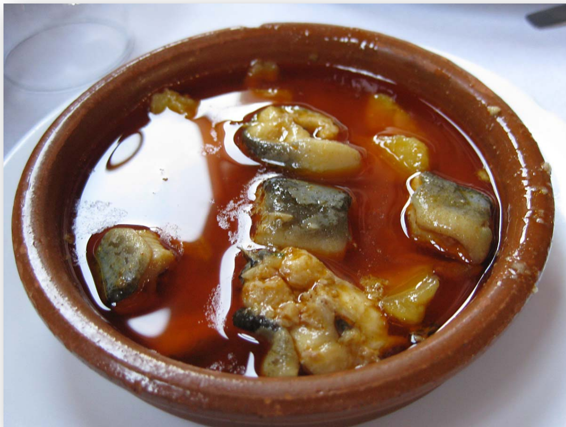
FOTO 8. All i pebre d'anguila