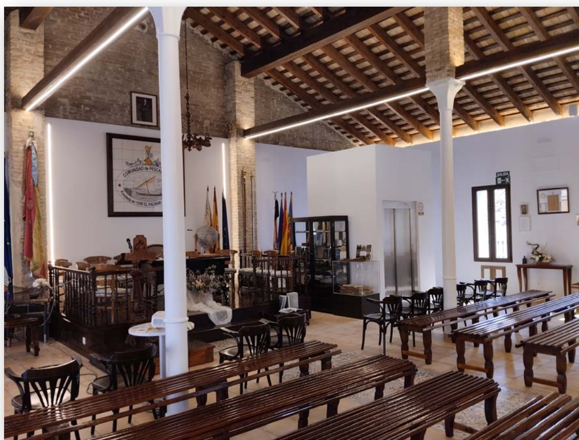
FOTOS 3 i 4. Saló principal de la Comunitat de Pescadors, en el qual es realitza el sorteig de redolins.