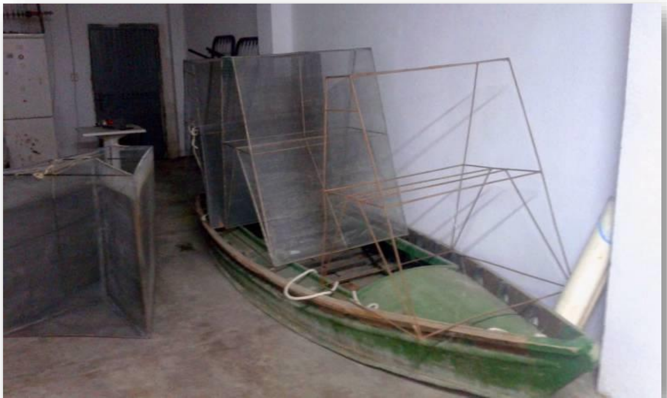
FOTOS 5 I 6: Monots per a la pesca d'anguila