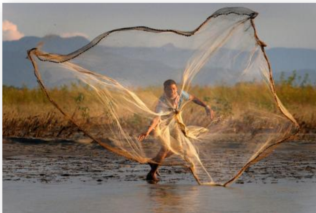
FOTOS 718. La pesca del rall