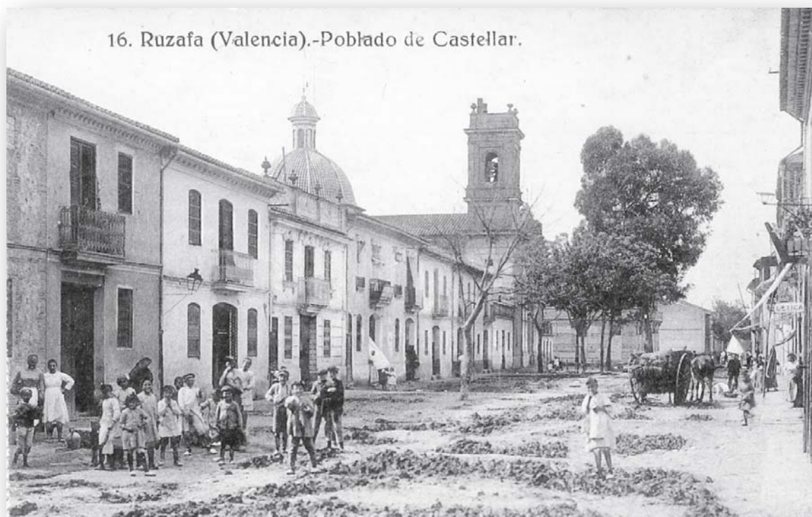
FOTO 1. La plaza de Patraix La plaça principal de Castellar amb l'església de Nostra Senyora de Lepant en 1921.