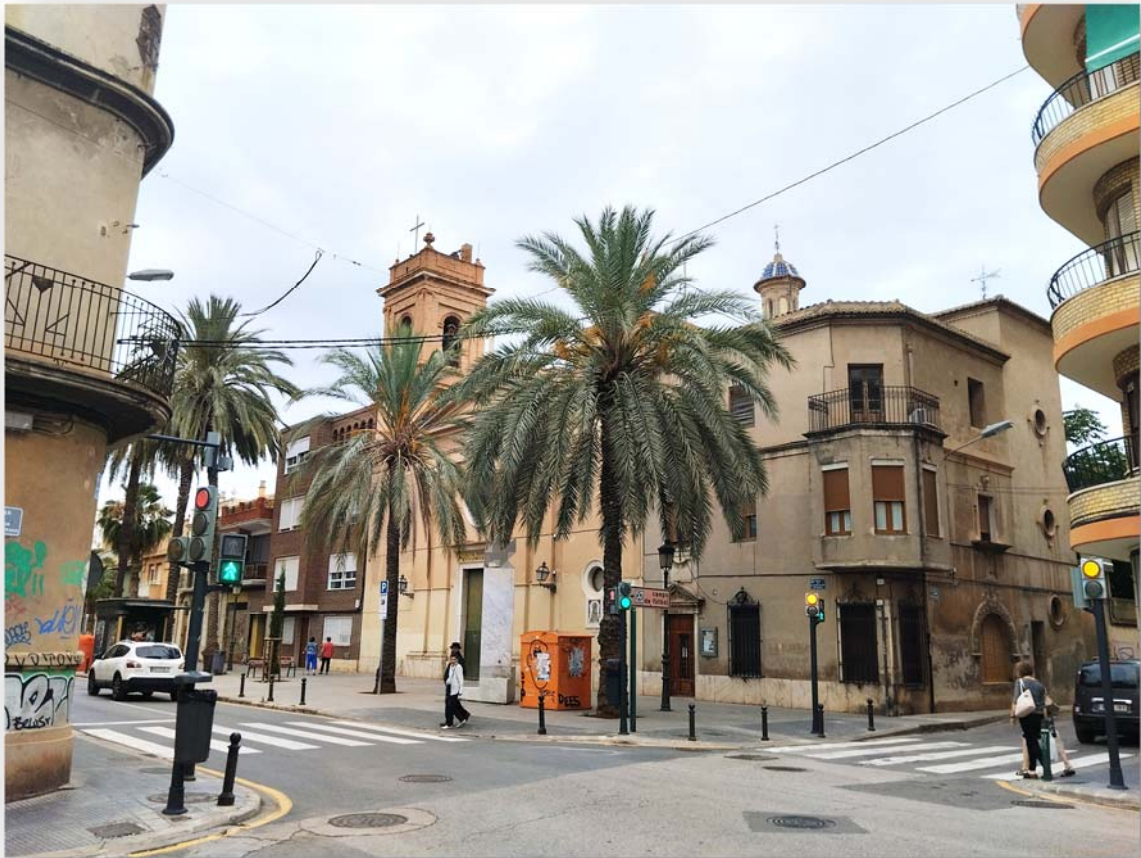
FOTOS 3 i 4. Vistes de l'església en l'actualitat des de diferents enquadraments