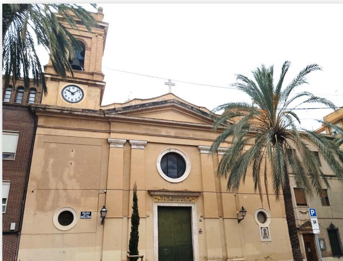
FOTO 2. La plaza de Patraix Frontera principal de l'església en l'actualitat.