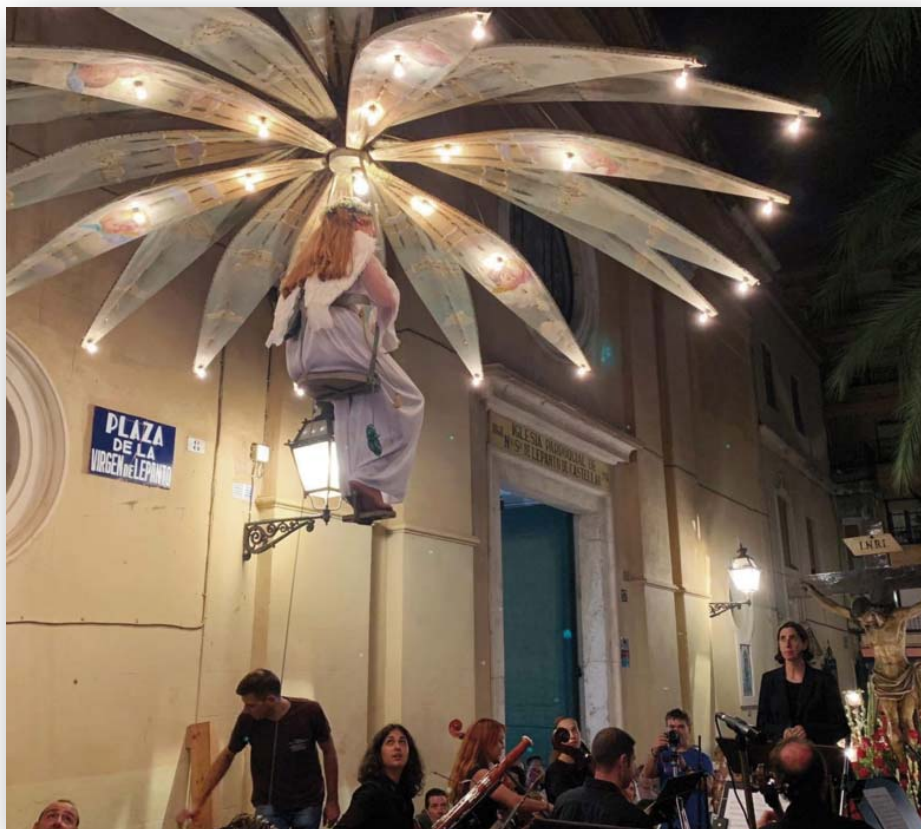
FOTOS 6 i 7. Edificio número 12 de la plaza de Patraix (primer plano en la actualidad y en la época en que acogió la sede de la asociación de vecinos del barrio). Fue la sede del ayuntamiento de Patraix en su etapa de municipio independiente. Imatge històrica del “Cant de la Carxofa” i representació actual