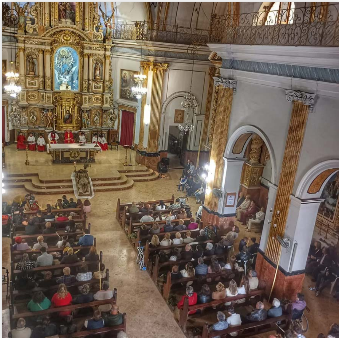
FOTO 5. Interior de l'església. Misma perspectiva en la actualidad.