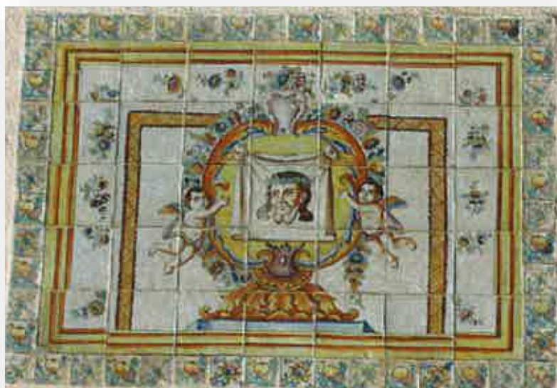
FOTOS 5 I 6. Retaules del segle XVIII en la frontera de la Casa Forestal, declarats Bé de Rellevància Local