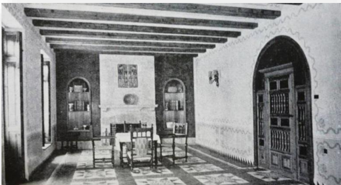
FOTOS 3 I 4: Images de la Casa Forestal en els anys 20 del segle XX.