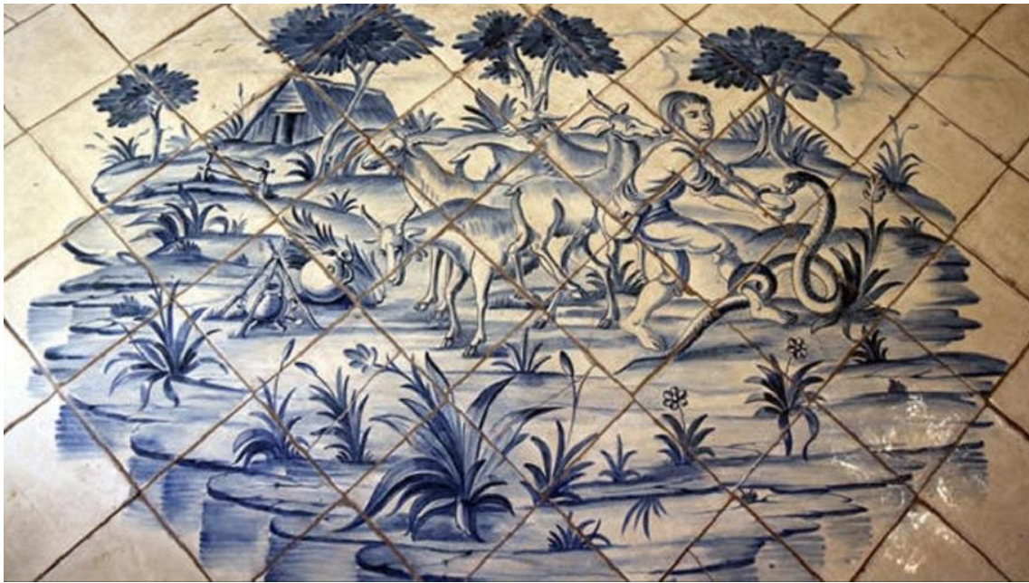
FOTO 9. Panell ceràmic que representa la llegenda de la serp Sancha.