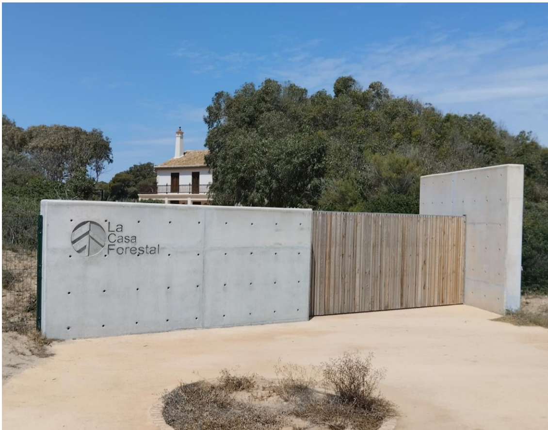
FOTO 10. Accés a la Casa Forestal des del passeig marítim.