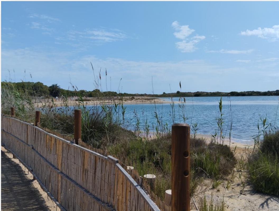
FOTOS 1 Y 2. El llac o estany del Pujol