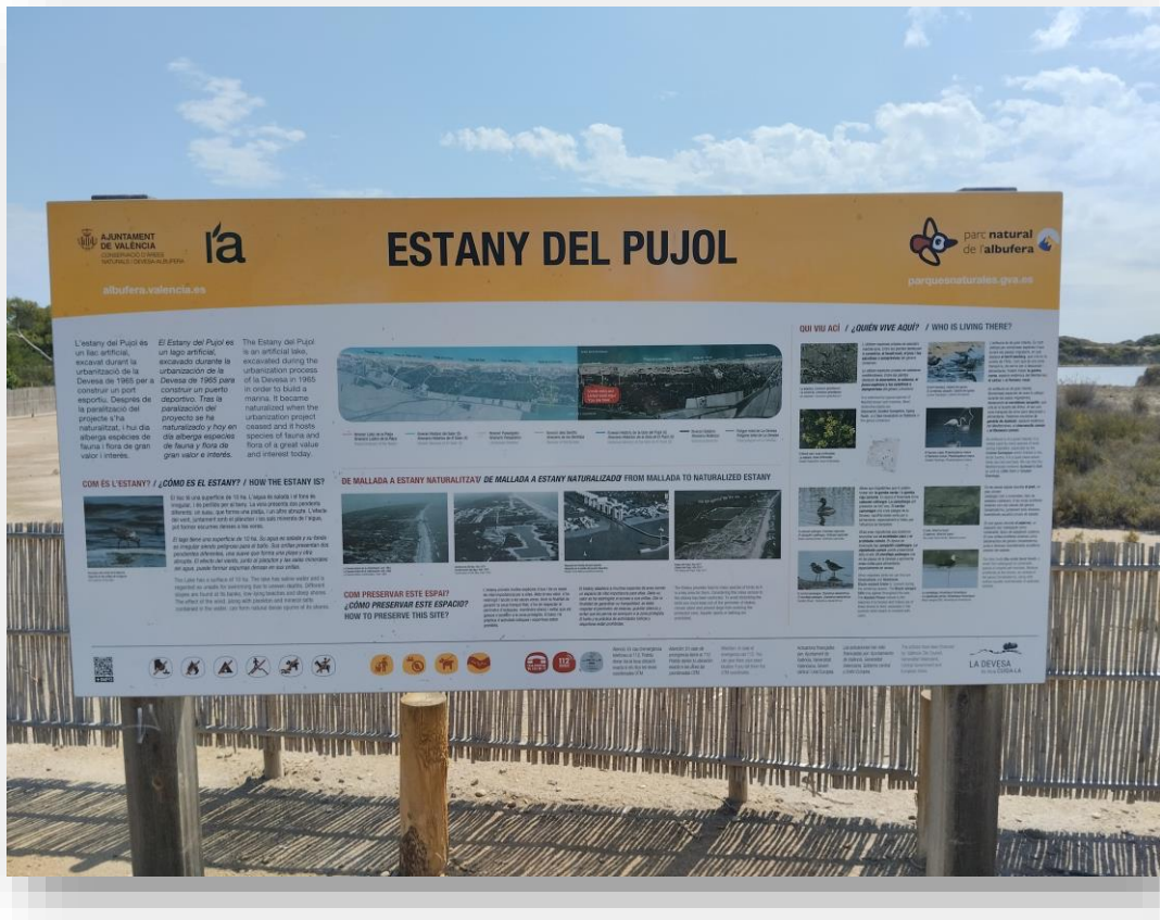
FOTO 5. Cartellera informativa del Parc Natural de l'Albufera