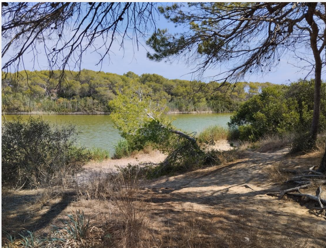
FOTO 6. Vista de l'entorn