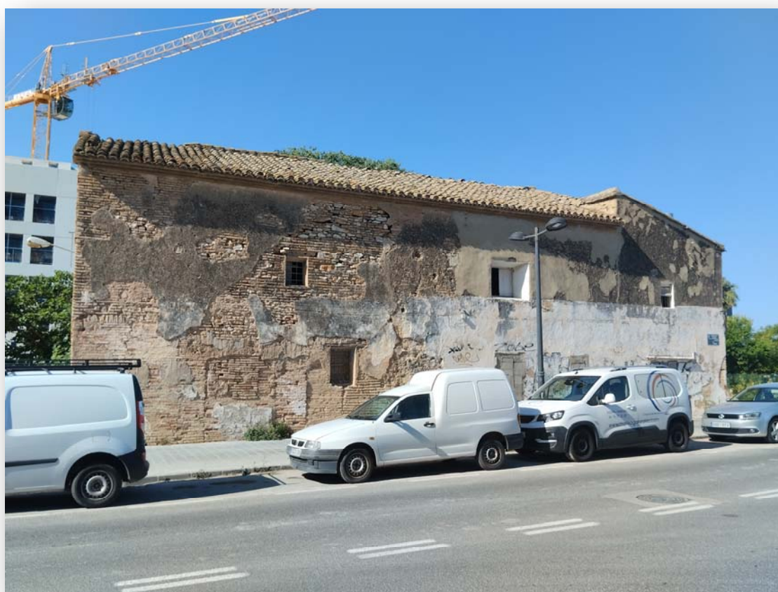
FOTOS 1 i 2. L'Alqueria de Pastor