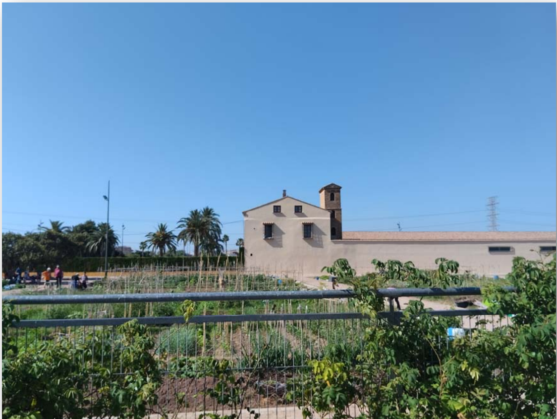
FOTOS 3 i 4. L'Alqueria de Saboner, al costat dels horts urbans de Sociòpolis.