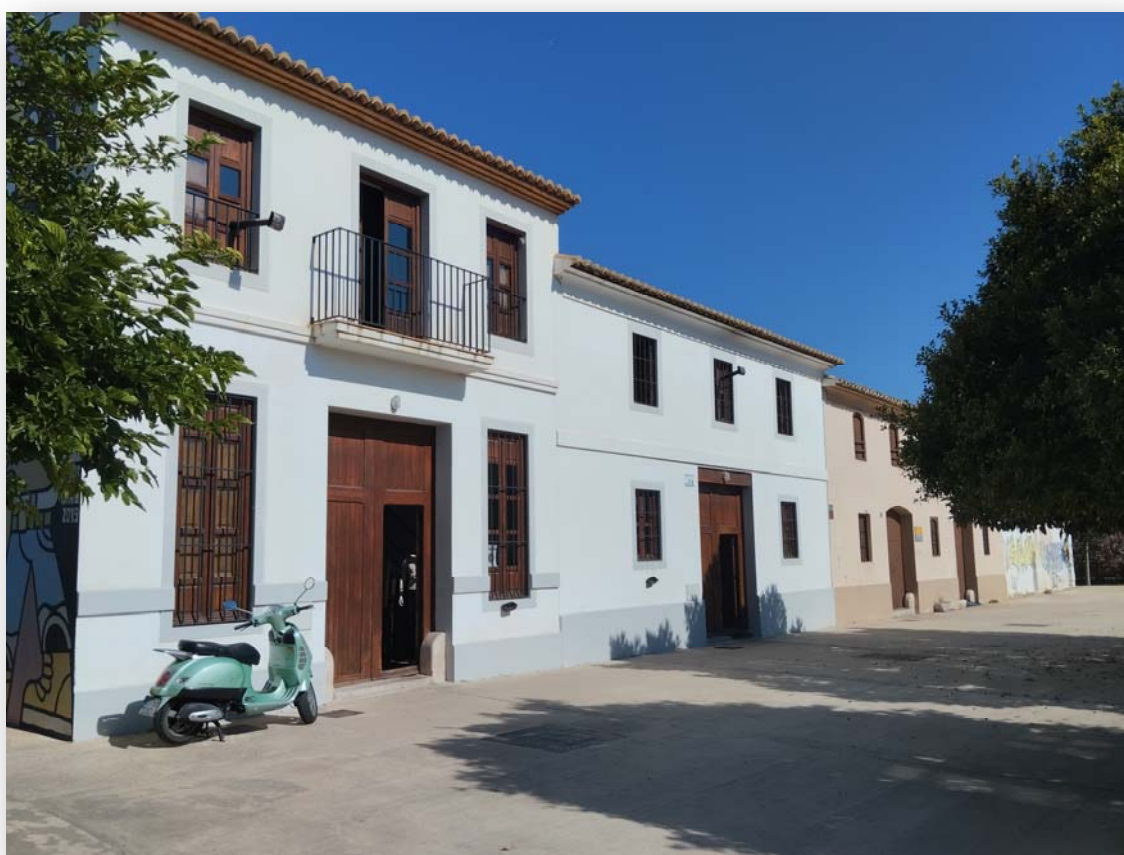
FOTOS 5 i 6. L'Alqueria de Coca