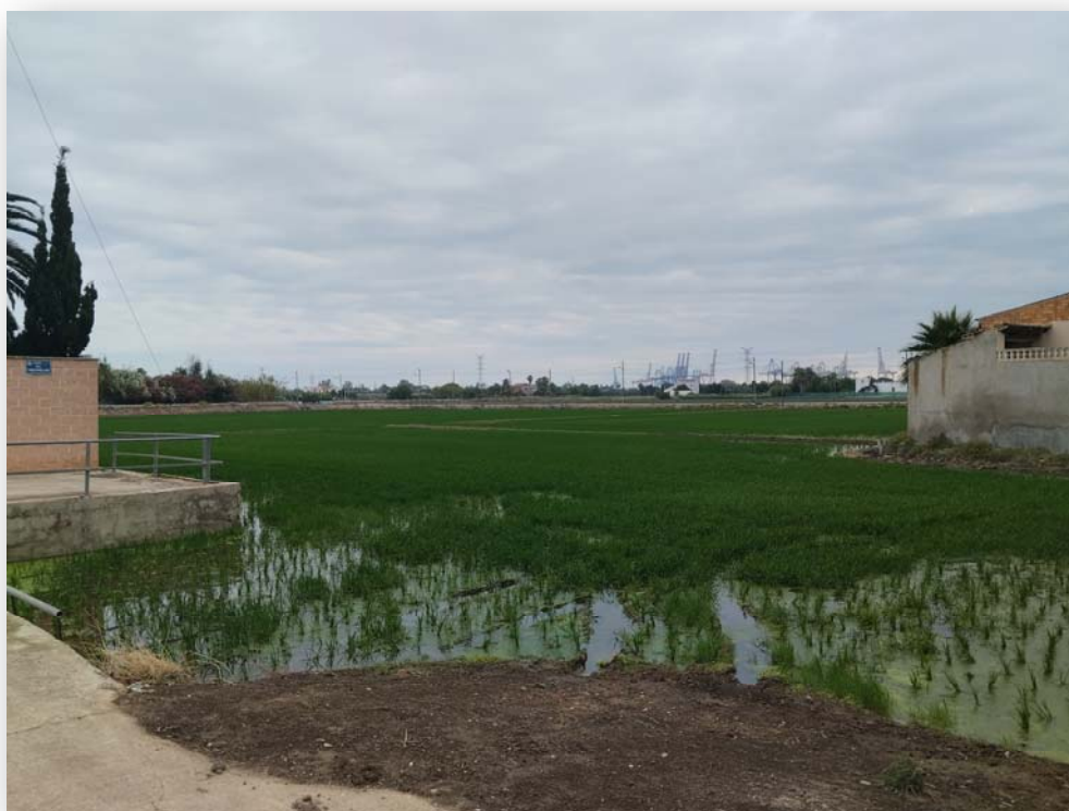
FOTO 2. Camp d'arròs en l'actualitat en el barri del Tremolar