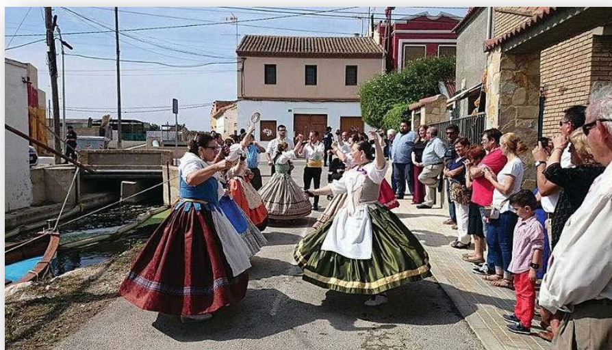
FOTOS 5, 6 i 7. Les festes de El Tremolar