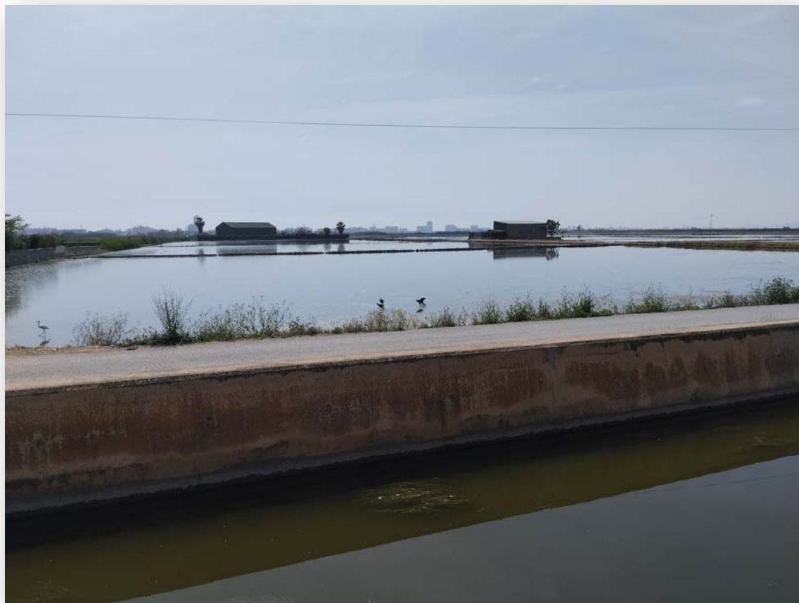
FOTO 9. Arrossars del Palmar