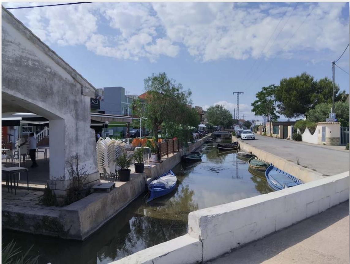
FOTOS 5 i 6. Embarcador