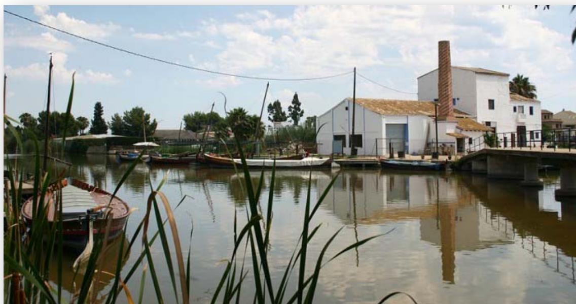
FOTOS 7 i 8. Trilladora del Tocayo