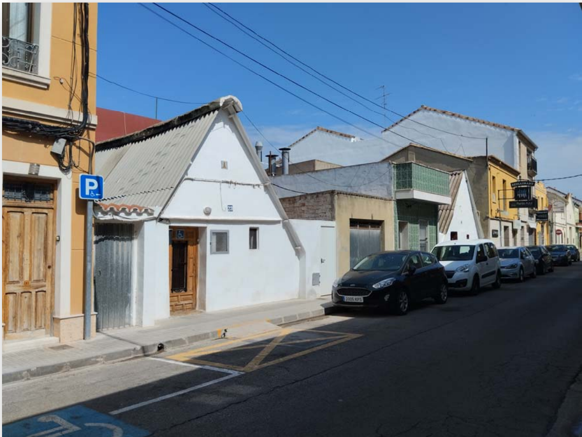
FOTOS 3 i 4. Barraques en els carrers del Palmar