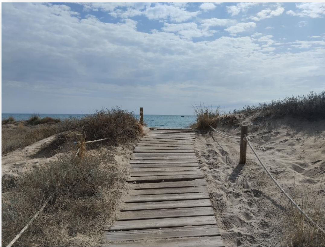
FOTO 1 Y 2: Accés a la platja del Perellonet a través de les dunes.