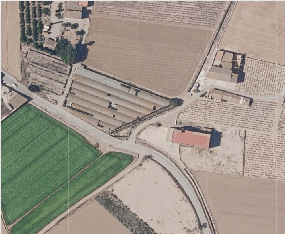
FOTO 1. Vista aérea de las lenguas de Ferrús-Borbotó