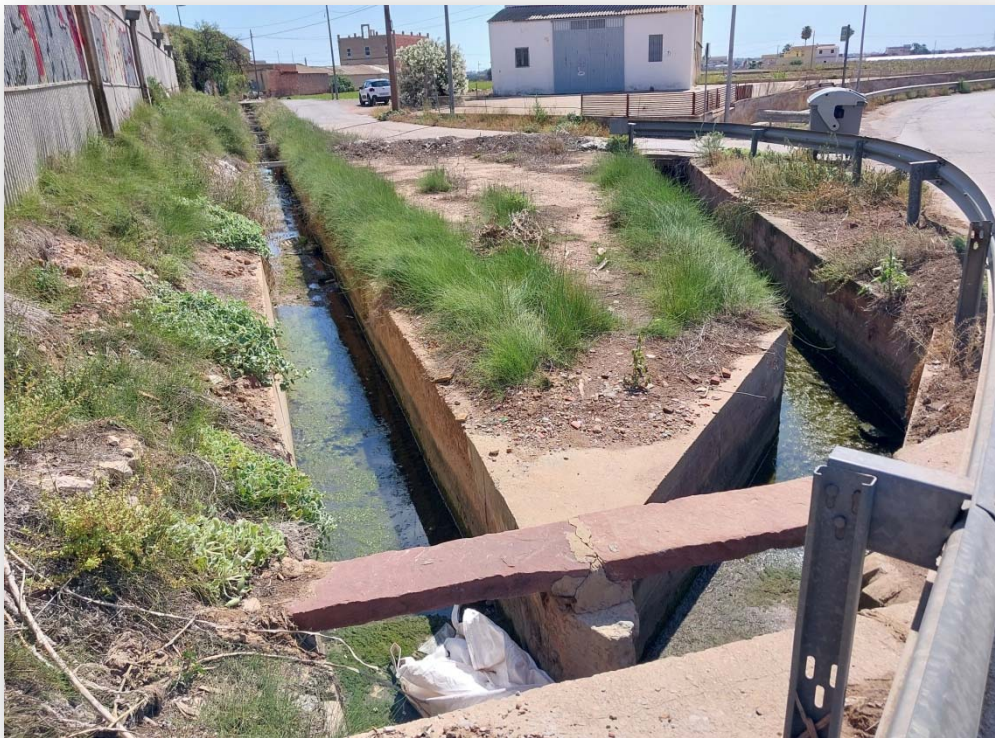
FOTO 2. Bifurcación de la acequia de Tormos conocida como lenguas de Ferrús-Borbotó.