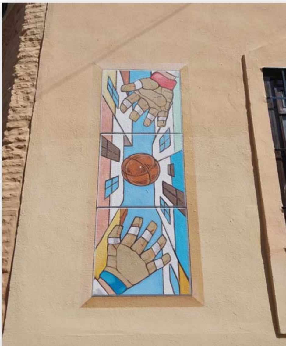
FOTO 3. Pintura dedicada a la pilota valenciana, situada en la frontera lateral de l'antiga alcaldia de Borbotó (cantonada del carrer Doctor Constantino Gómez amb la plaça del Moreral).