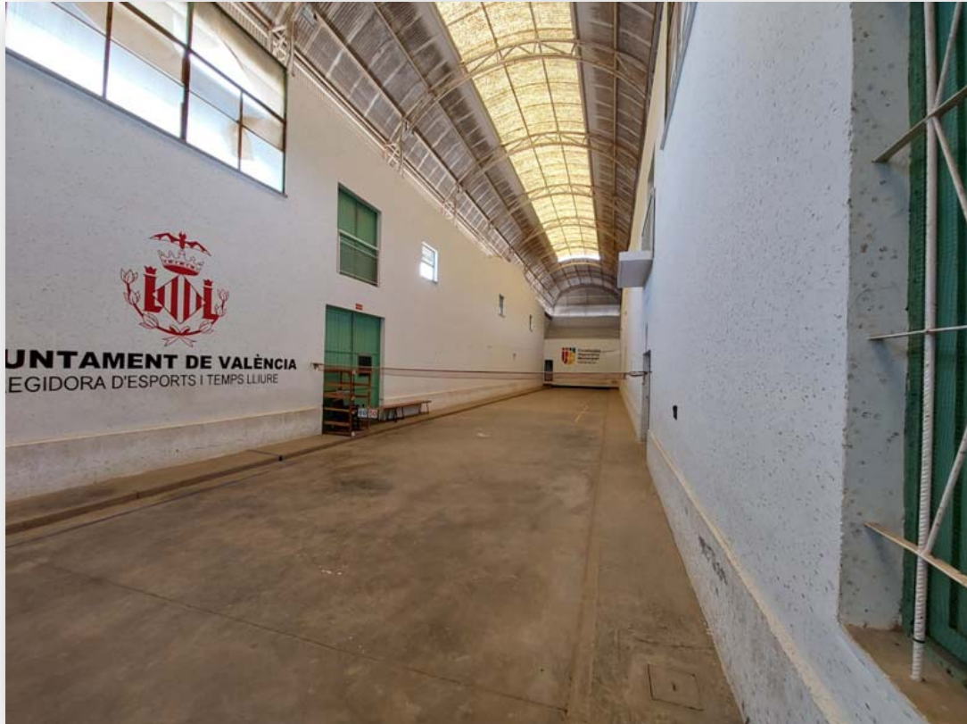
FOTO 1. Trinquet de pilota valenciana de Borbotó