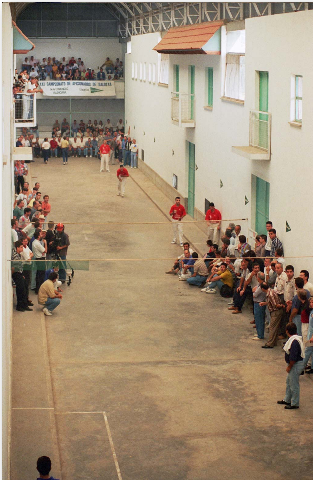
FOTO 2. Partida de pilota valenciana en el trinquet de Borbotó.