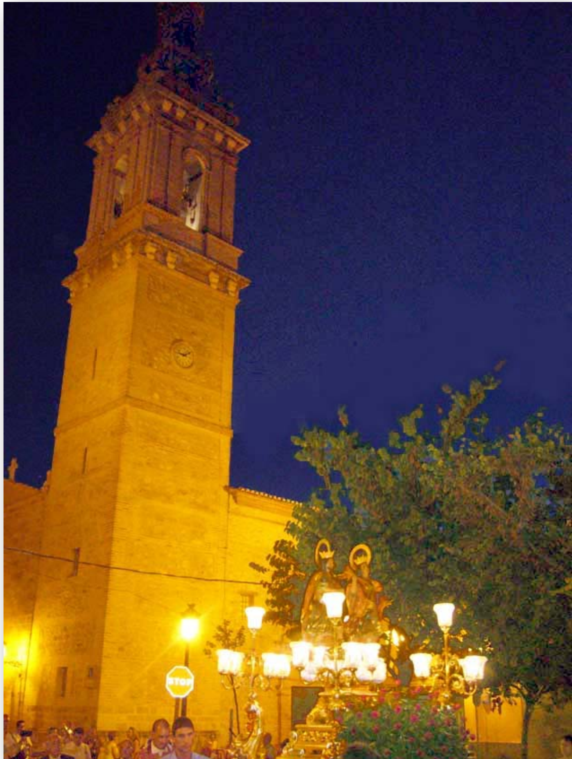
FOTO 7. Els Sants Abdó i Senent de Carpesa durant la processó.