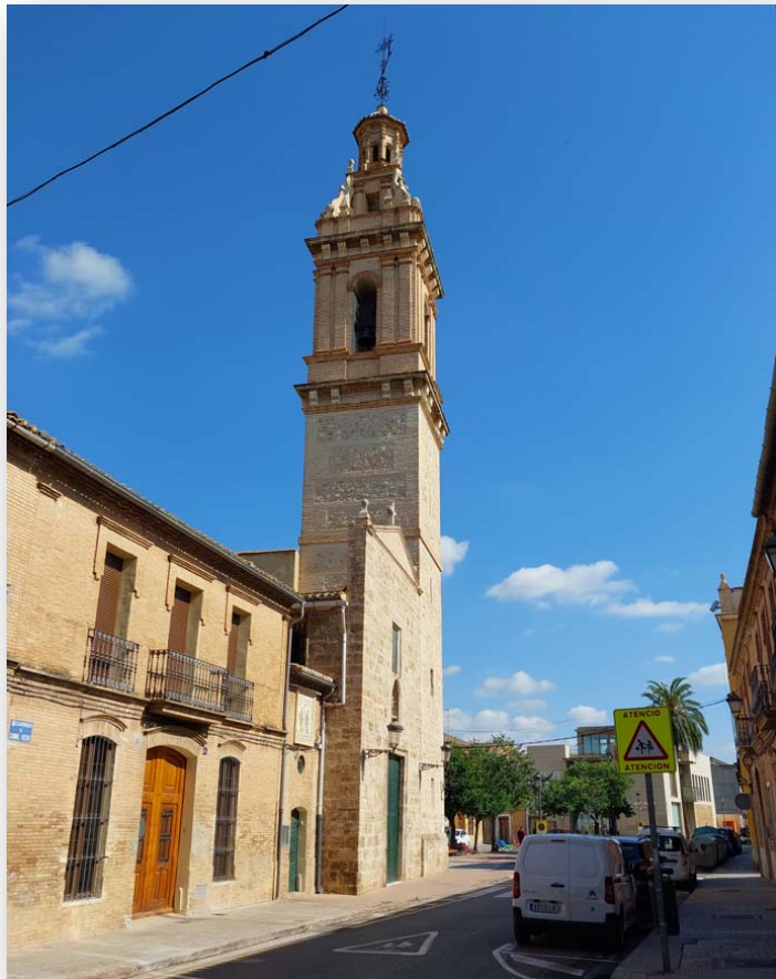
FOTOS 1 i 2. Església dels Sants Abdó i Senent des de diferents perspectives.