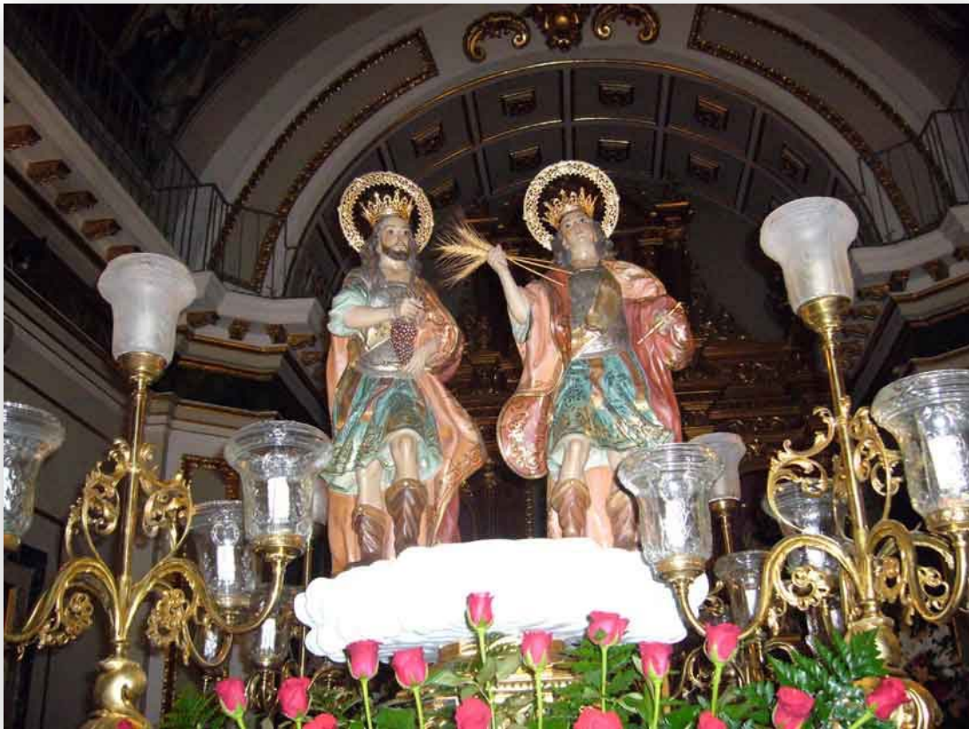
FOTO 5. Els Sants Abdó i Senent de Carpesa.