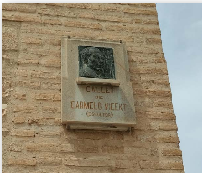
FOTOS 3 i 4. Església dels Sants Abdó i Senent. Detall de les portes, amb mosaic i escultura dels patrons, i placa dedicada a Carmelo Vicent, escultor nascut en la localitat, l'escultor restaurador de la imatge de la Verge dels Desemparats ("la Geperudeta") i autor de la Pelegrina (vore fitxa 2 de la ruta).