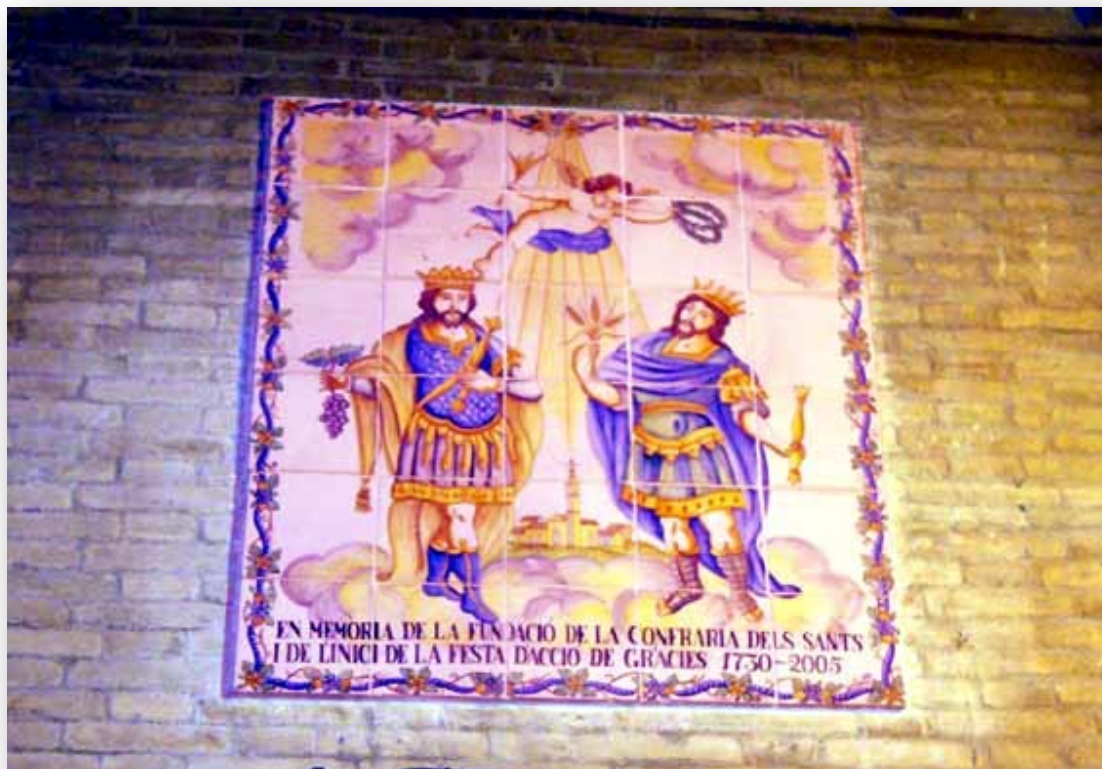
FOTO 6. Detall del retaule ceràmic dels Sants Abdó i Senent de Carpesa.