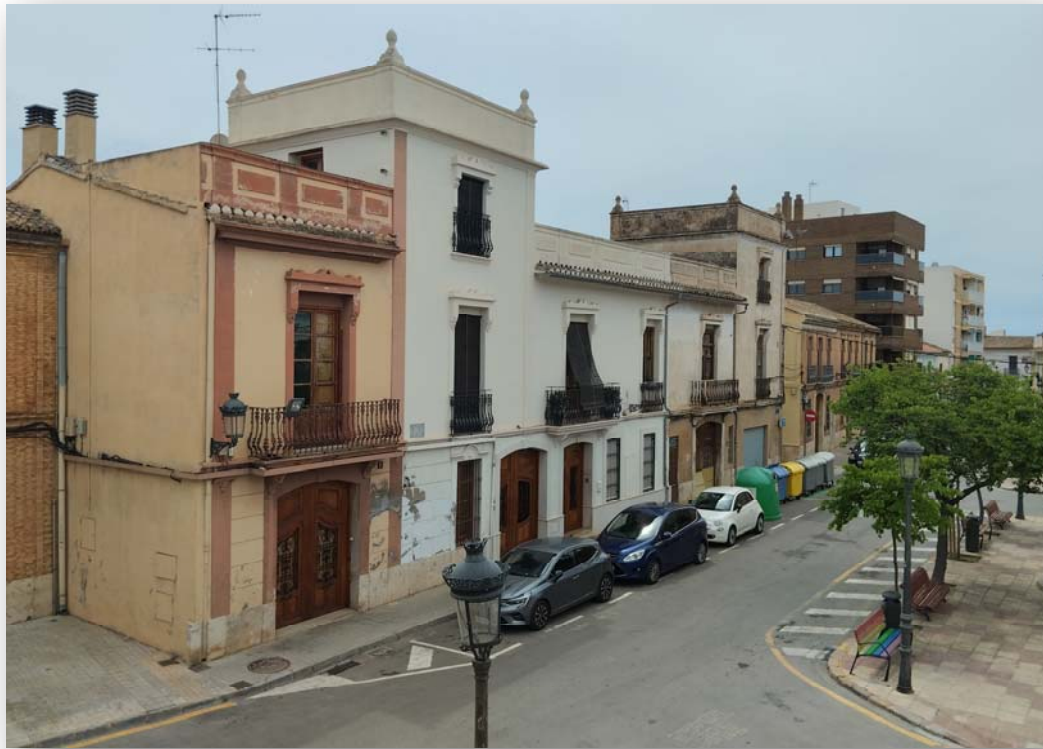
FOTO 7: Antic palau en la plaça del Poble, alçat en temps del senyoriu de l'Orde de Montesa.