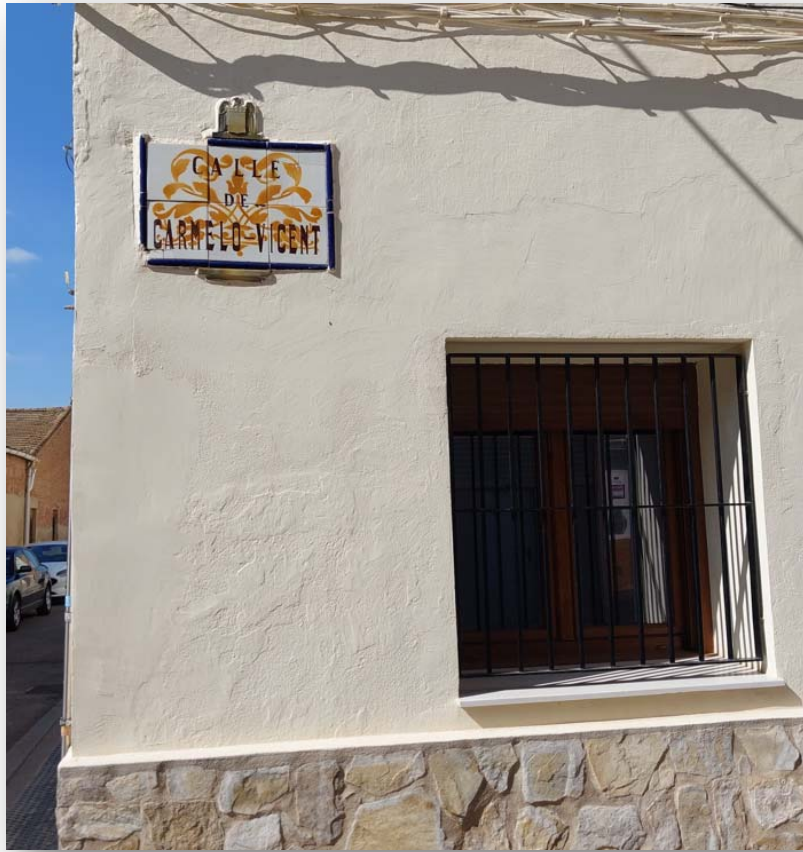
FOTO 5: Carrer dedicat a l'escultor Carmelo Vicent, originari de Carpesa.