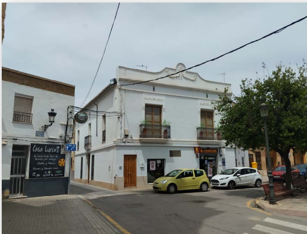
FOTO 8. Cases tradicionals valencianes