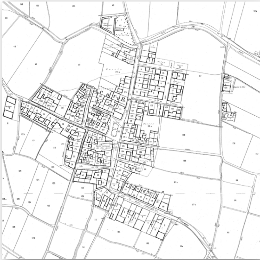
FOTO 3: Pla cartogràfic de Carpesa. 1929-1945.