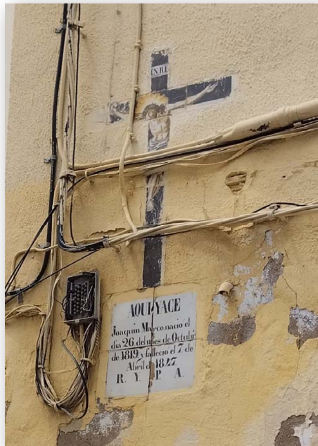
FOTOS 9 i 10: Casa tradicional en el carrer Carmelo Vicent, amb un interessant panell ceràmic que conté el record d'una persona soterrada ací.