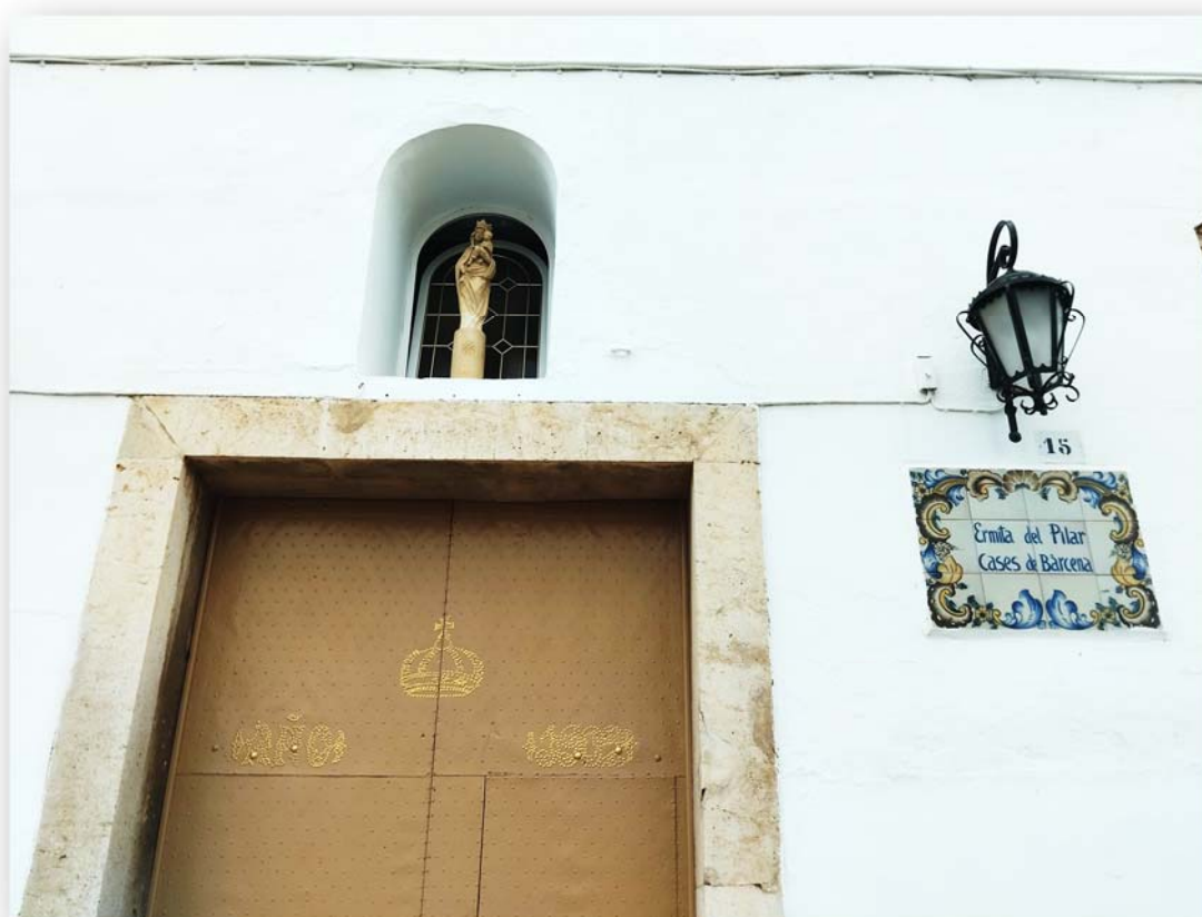
FOTOS 1 y 2. Ermita del Pilar. Cases de Bàrcena.