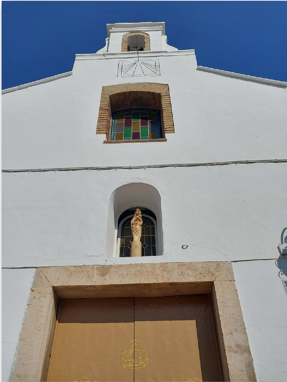
FOTO 3. Detalle de figura, ventana y reloj de sol.