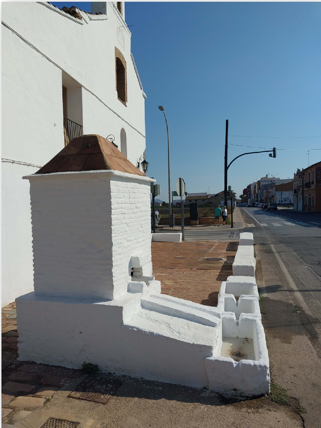
FOTO 4. Detalle del abrevadero junto a la ermita.