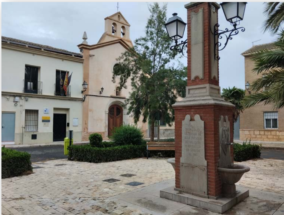
FOTOS 1 y 2. Iglesia parroquial de San Benito, en la plaza del mismo nombre