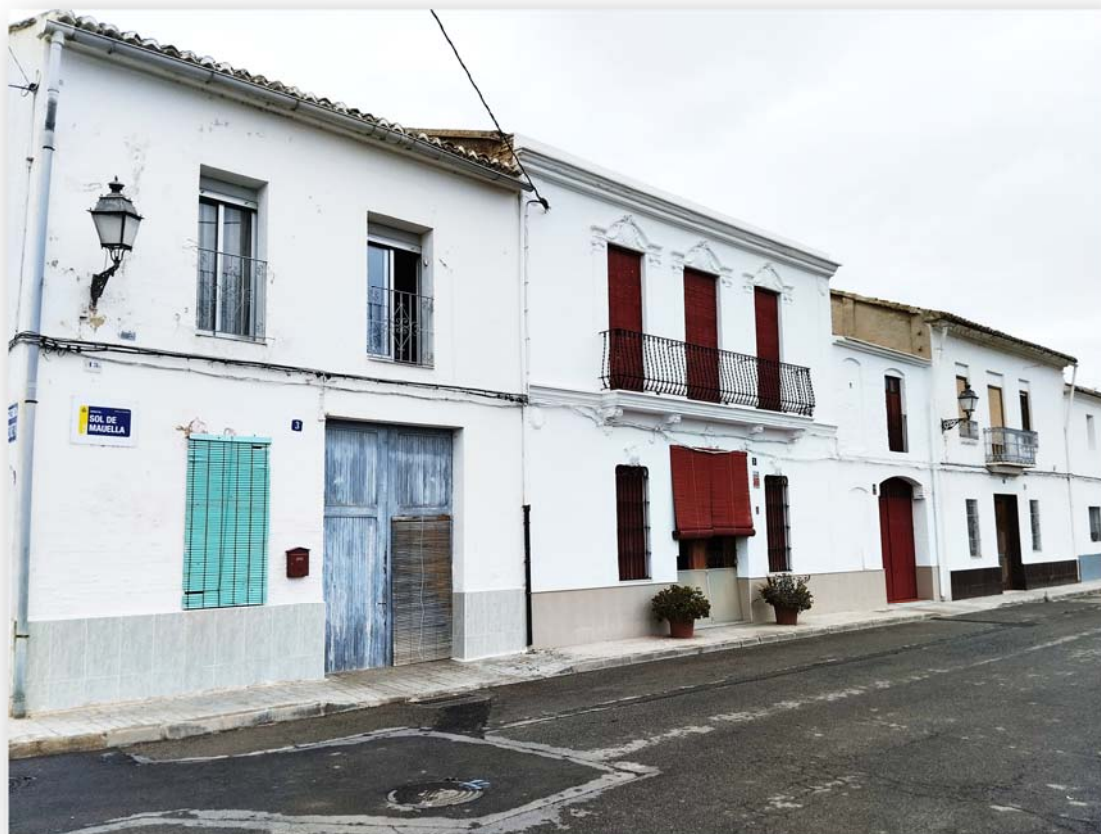
FOTOS 3 Y 4. Viviendas del núcleo de Mauella