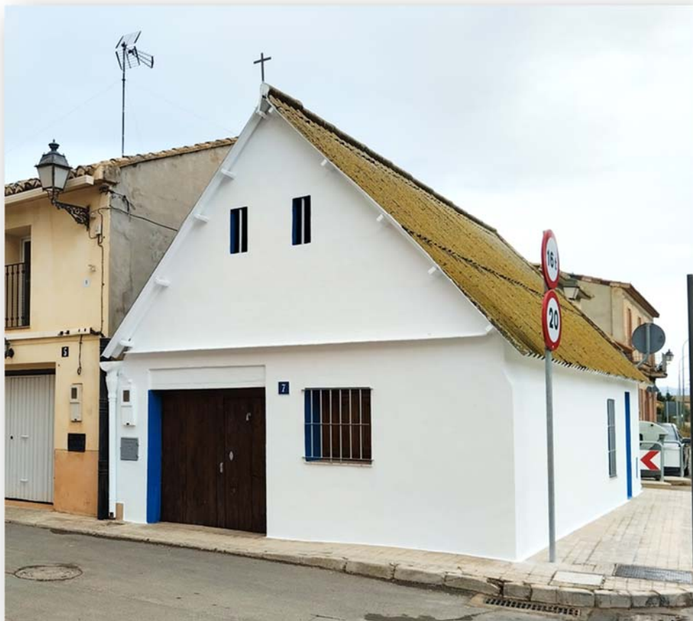
FOTO 5. Barraca de Pablo o del Amo, en el barrio de las Sidras