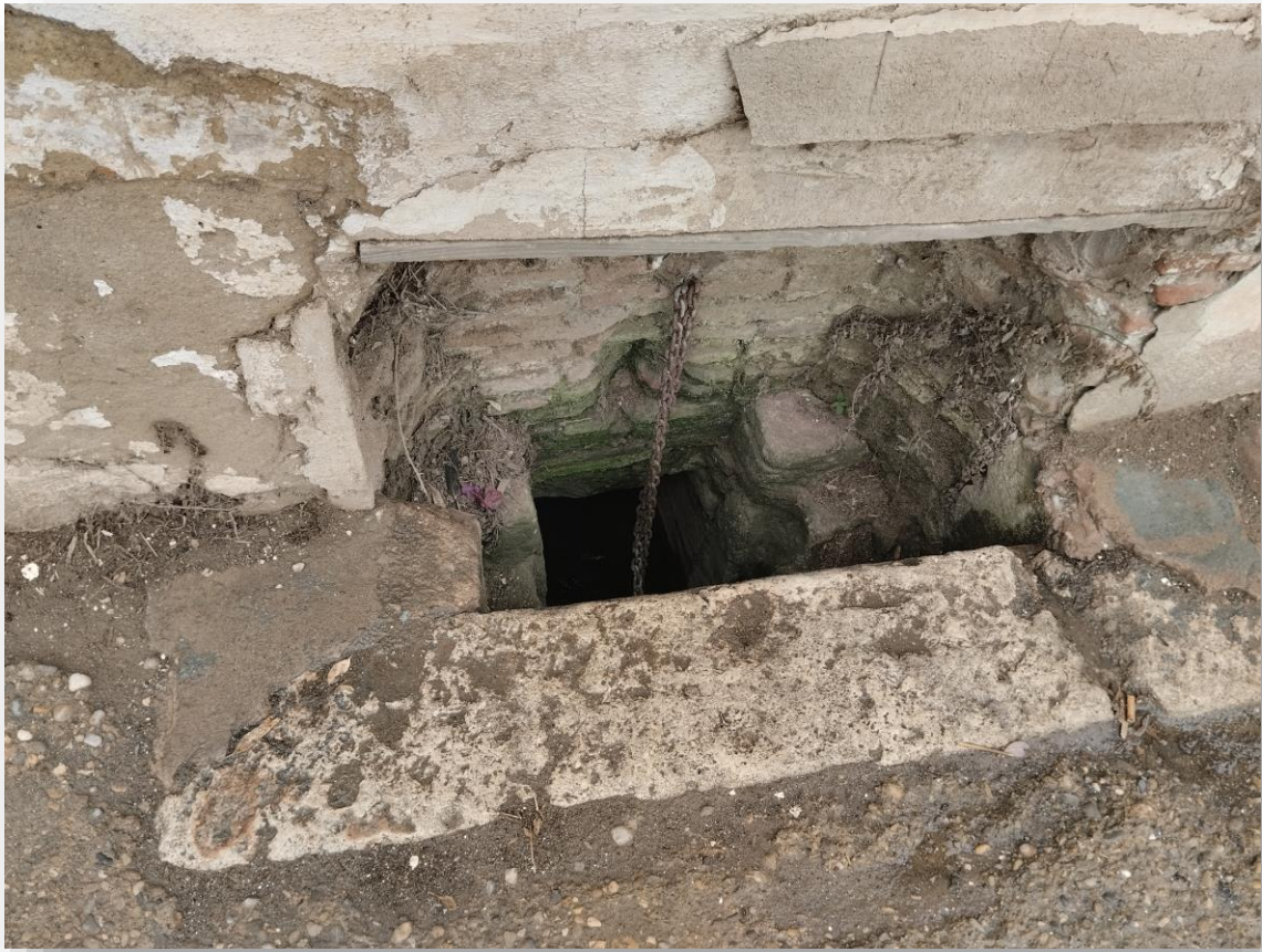
FOTO 3. Detalle del sistema hidráulico del Molí dels Alters