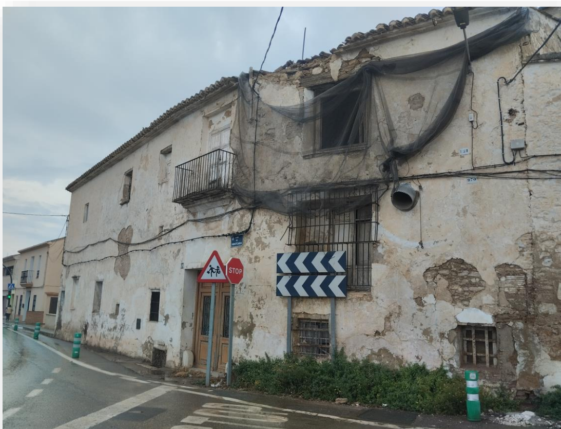
FOTO 1 y 2. Molí del Alters desde distintas perspectivas