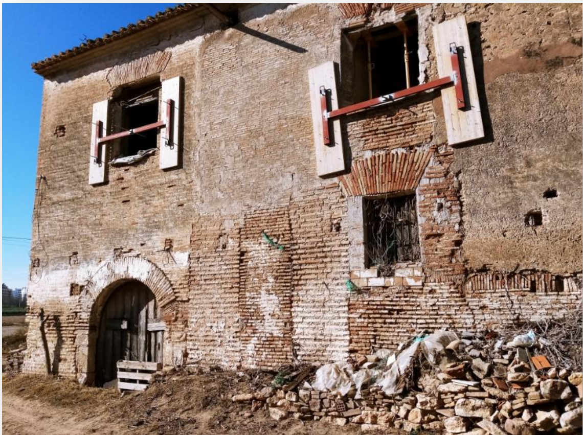
FOTO 4. Alqueria de Tallarròs