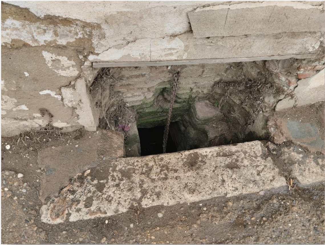
FOTO 3. Detall del sistema hidràulic del Molí dels Alters