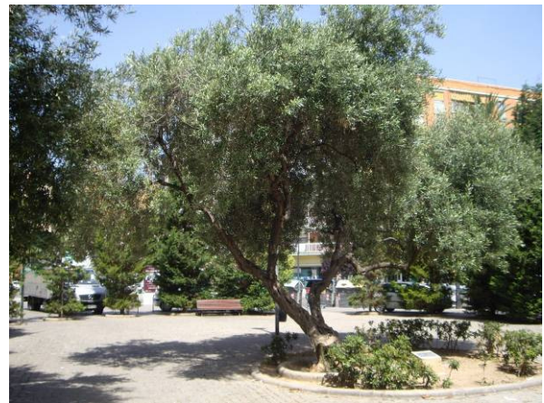
Ejemplar central.