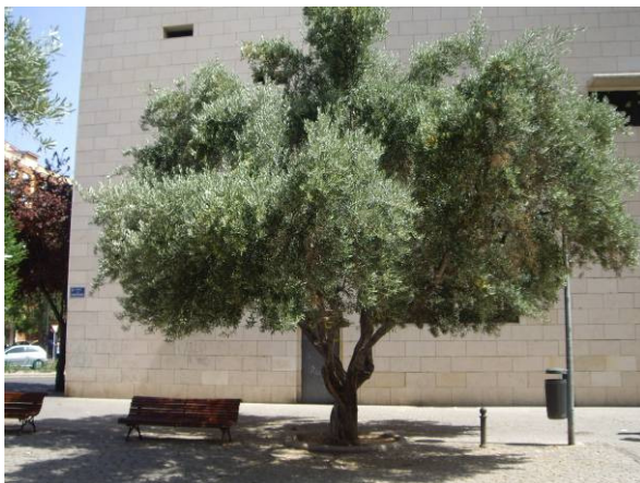
Ejemplar más al Norte.