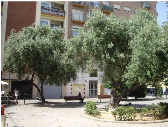
Vista general. Fuente DIDA.

El reconocimiento de los vecinos hacia estos olivos se plasmó en Abril de 2007, cuando fueron apadrinados como los árboles del barrio, según reza en la placa al pie de uno de ellos. Este apadrinamiento se va a repetir en Junio de 2014.