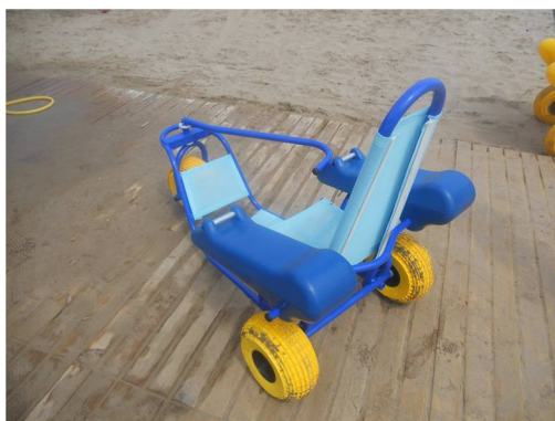
Cadira anmfibia per a xiquets

✚ Cadires amfibies. Constituïxen l'element clau per al bany, ja que gràcies a elles són introduïts en l'aigua per a romandre banyant-se, sent pioners en la utilització de les mateixes en la platja.