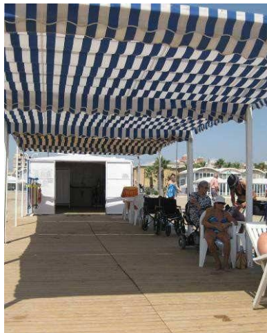
Punt Accessible MALVARROSA

🚫 Casetes destinades al programa en el punt accessible , que disposen de senyalització visual en forma de cartells. El recinte de cada punt accessible ocupa una superfície delimitada i exclusiva per a usuaris discapacitats, i en el mateix recinte es troben les dutxes adaptades i el vestuari adaptat, una zona d'ombra amb plataforma de fusta amb una superfície àmplia per a la permanència dels usuaris en cadira de rodes, rampes o plataformes de fusta per a facilitar l'accessibilitat, ombrel·les de palla, tendals, etc.