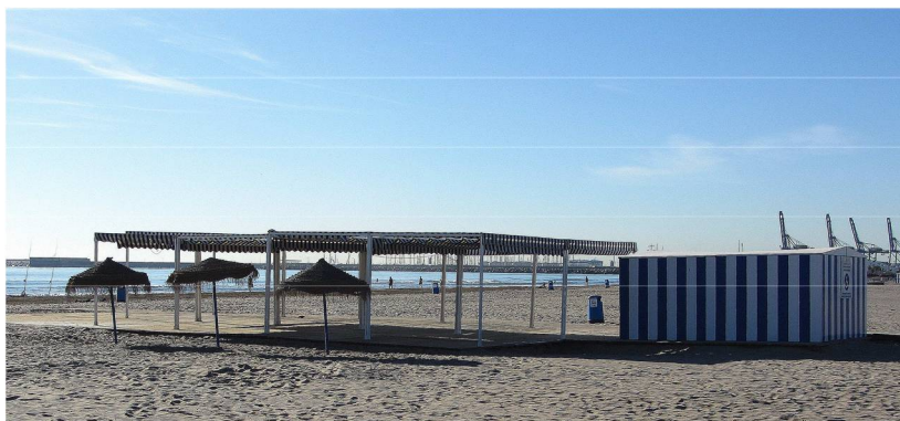
Punt Accessible CABANYAL

✚ Cadires amfibies. Constituïxen l'element clau per al bany, ja que gràcies a elles són introduïts en l'aigua per a romandre banyant-se, sent pioners en la utilització de les mateixes en la platja.