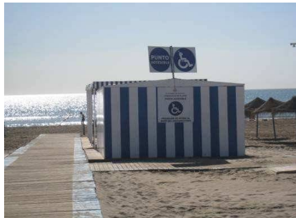
Punt Accessible PINEDO