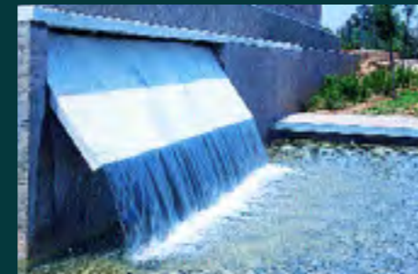
Cascada del Azud