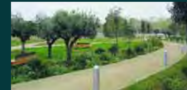
Camino en el Jardín de la Rambleta