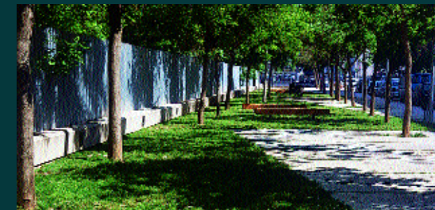
Zona exterior del Parque