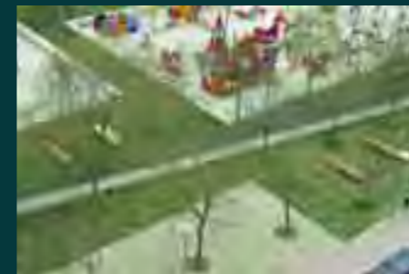
Vista aérea de la zona de juegos y de la zona abierta