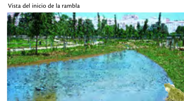
Vista del inicio de la rambla