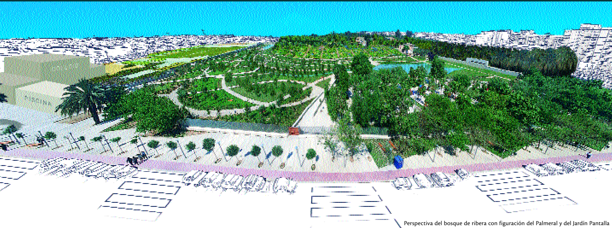
Perspectiva del bosque de ribera con figuración del Palmeral y del Jardín Pantalla