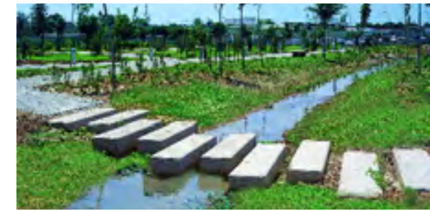
Paso sobre la rambla

Los senderos de tierra constituyen los recorridos interiores de los jardines. Estos senderos, rectilíneos en el Jardín Pantalla, el Palmeral y el Jardín Mediterráneo, se tornan sinuosos en el bosque de ribera y nos invitan a pasear sin prisas y sin rumbo aparente, nos llevan a los lugares más