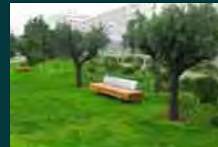
Praderas y olivos en el Jardín de la Rambleta