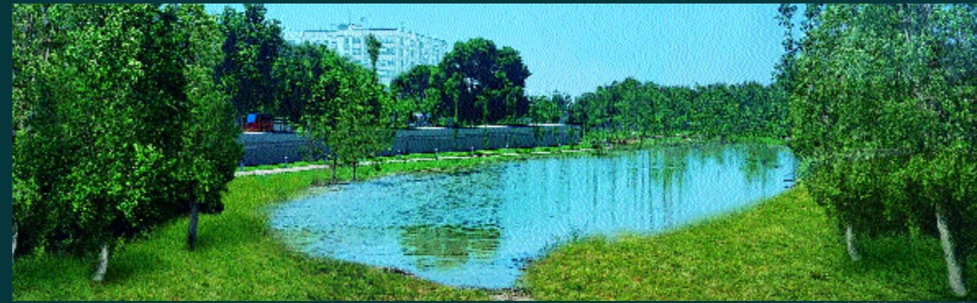
La Laguna, rodeada del bosque de ribera

Con sus casi 14 hectáreas, el Parque de la Rambleta es un gran espacio pensado para disfrutar con los cinco sentidos, un oasis de naturaleza dentro de un entorno urbano.