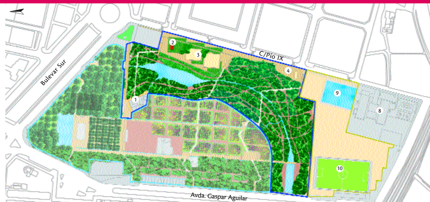
Figuración en planta de la totalidad del parque

SUPERFICIE TOTAL= 14 Ha. JUNIO 2002 ≈ 5,5 Ha EN EJECUCIÓN EN PROYECTO