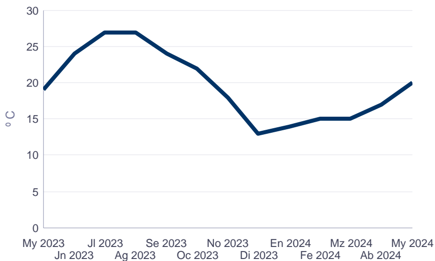
Temperatura media mensual. Estación Viveros Temperatura mitjana mensual. Estació Vivers

Nota: La temperatura se expresa en grados centígrados. Fuente: Agencia Estatal de Meteorología. Nota: La temperatura s'expressa en graus centígrads. Font: Agència Estatal de Meteorologia.